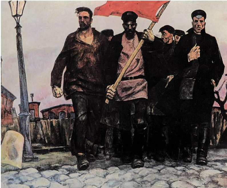
Революция 1905 – 1907 гг. в России