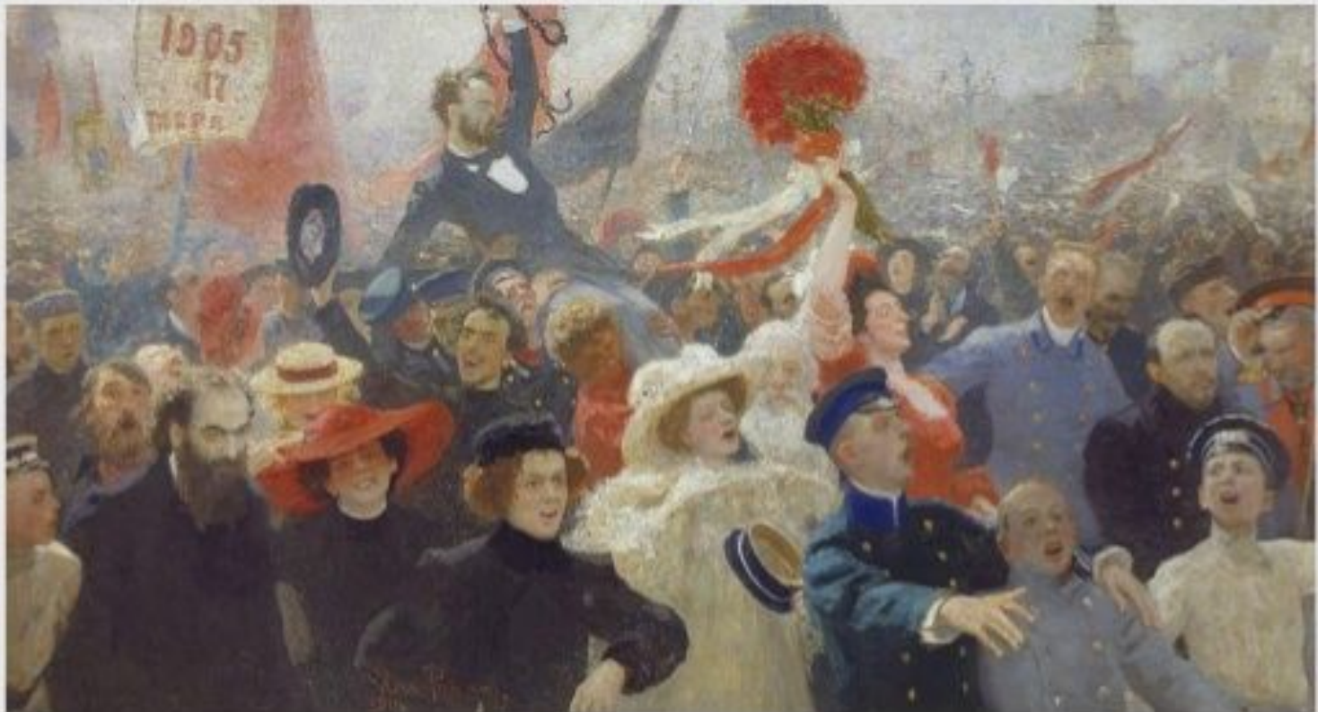
Илья Репин. 17 Октября 1905