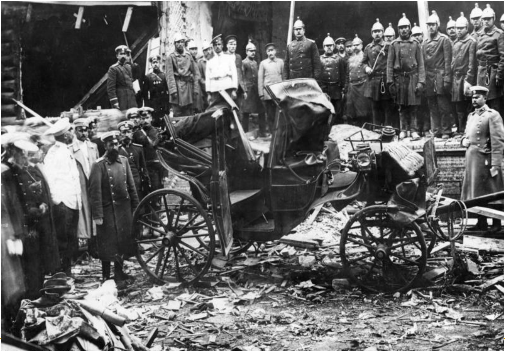
August 1906