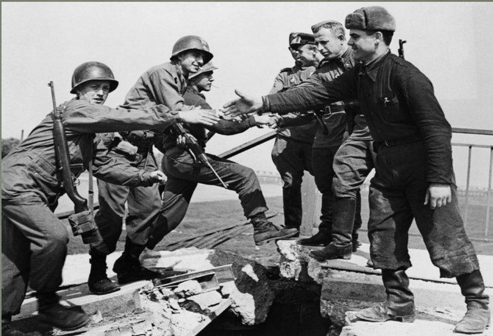
СОВЕТСКИЕ И АМЕРИКАНСКИЕ ВОЙСКА ВСТРЕЧАЮТСЯ НА РЕКЕ ЭЛЬБА