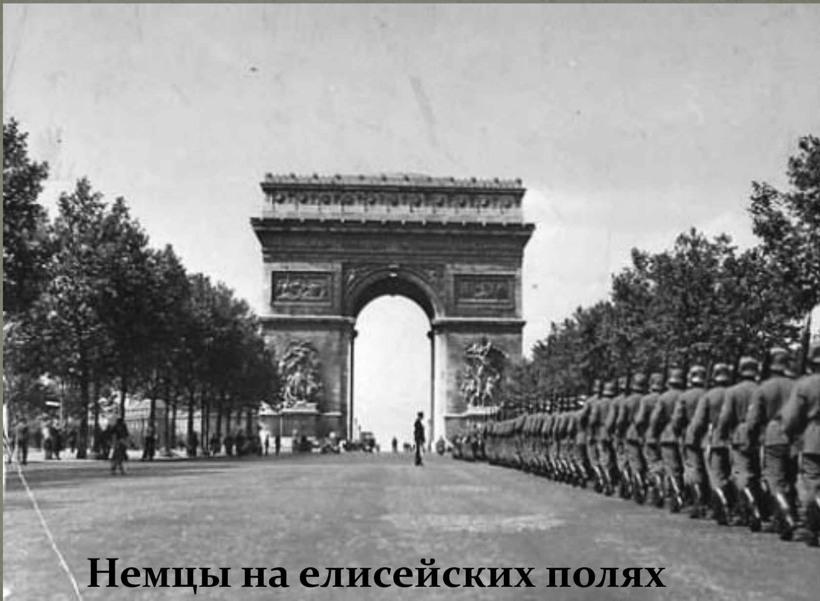
Немцы на елисейских полях