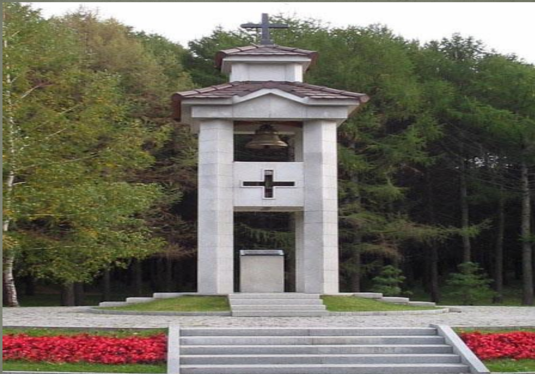
Памятник испанцам, погибшим во второй мировой войне.