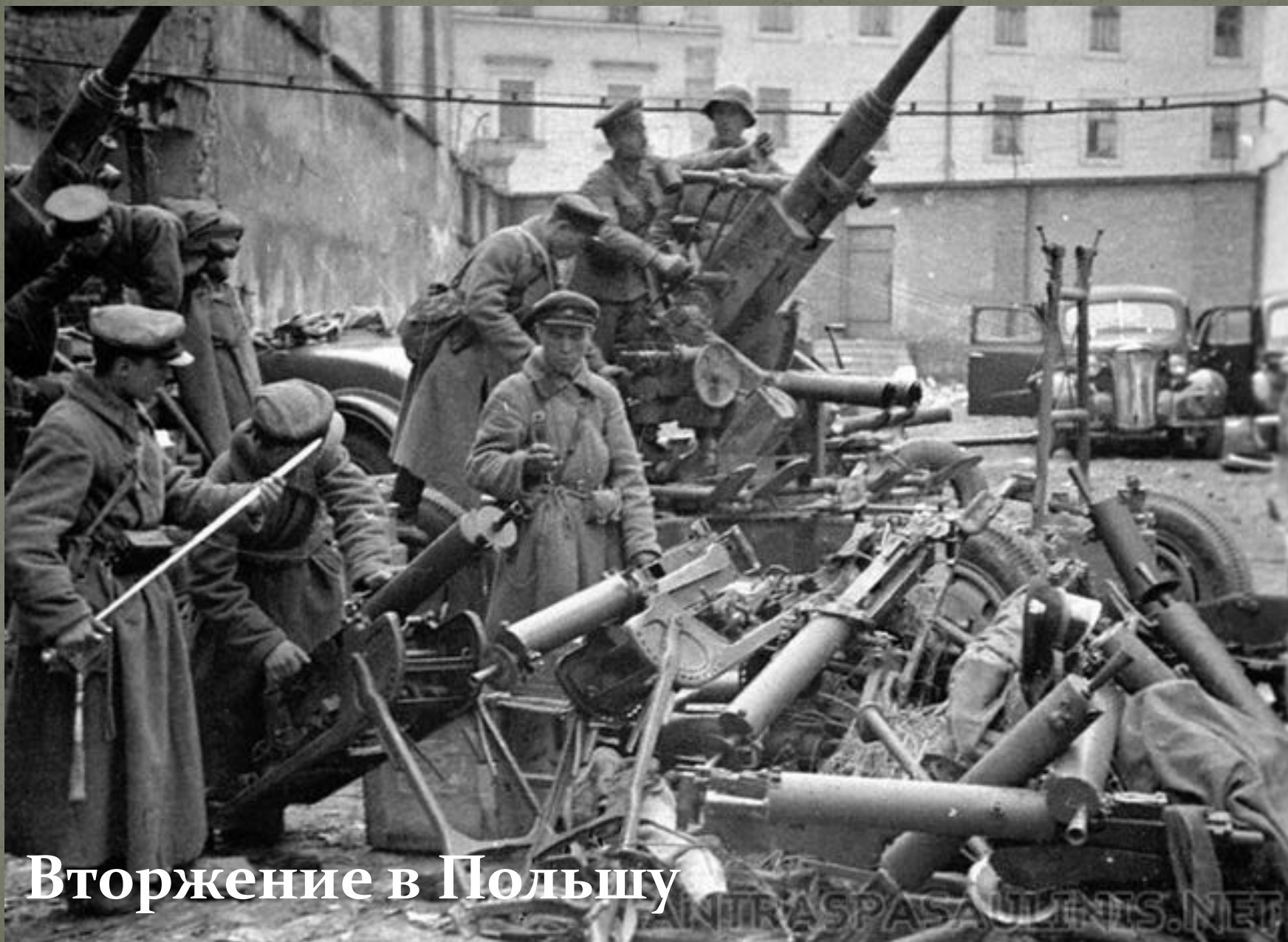
Вторжение в Польшу