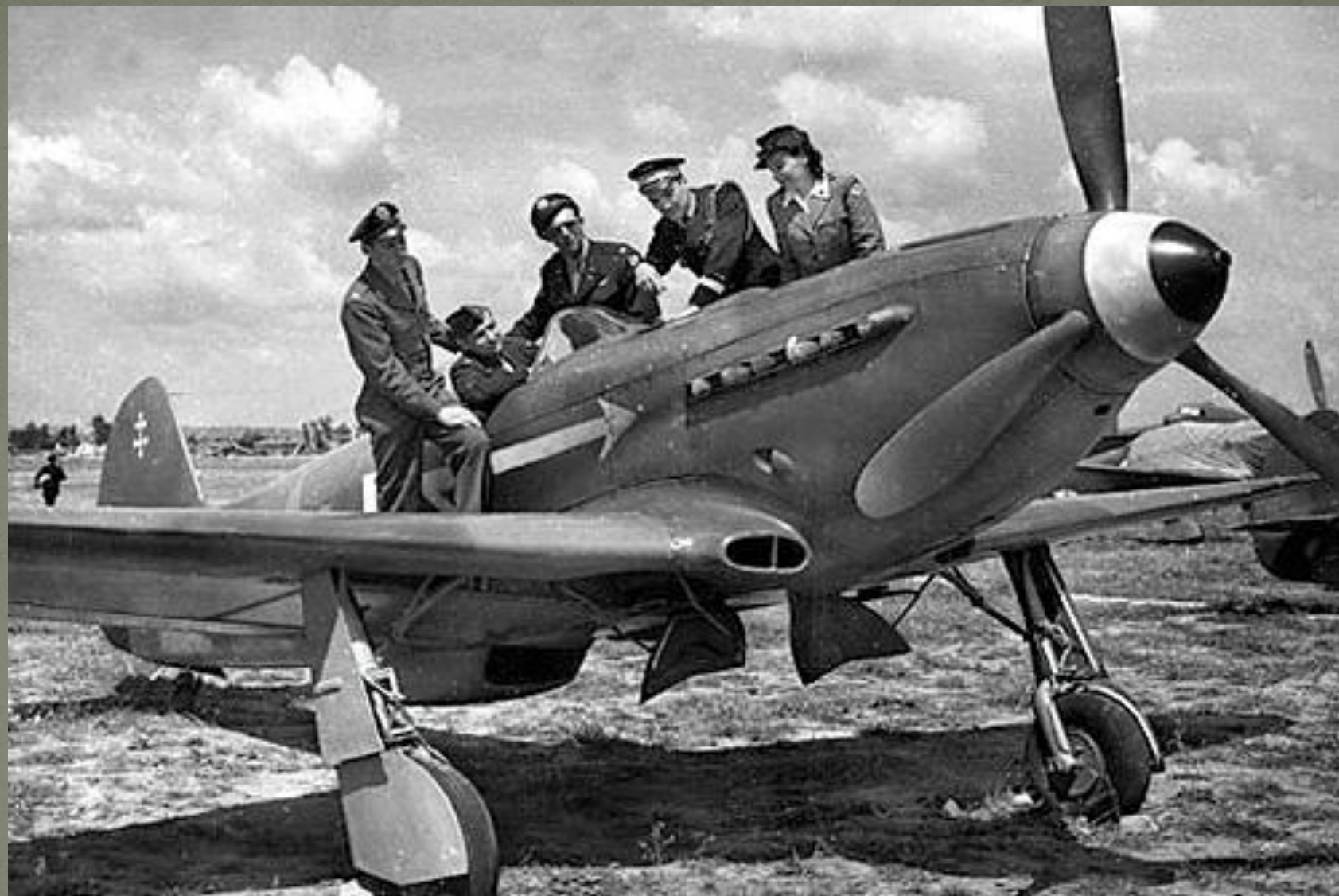
Французская воздушная эскадрилья "Нормандия-Неман"