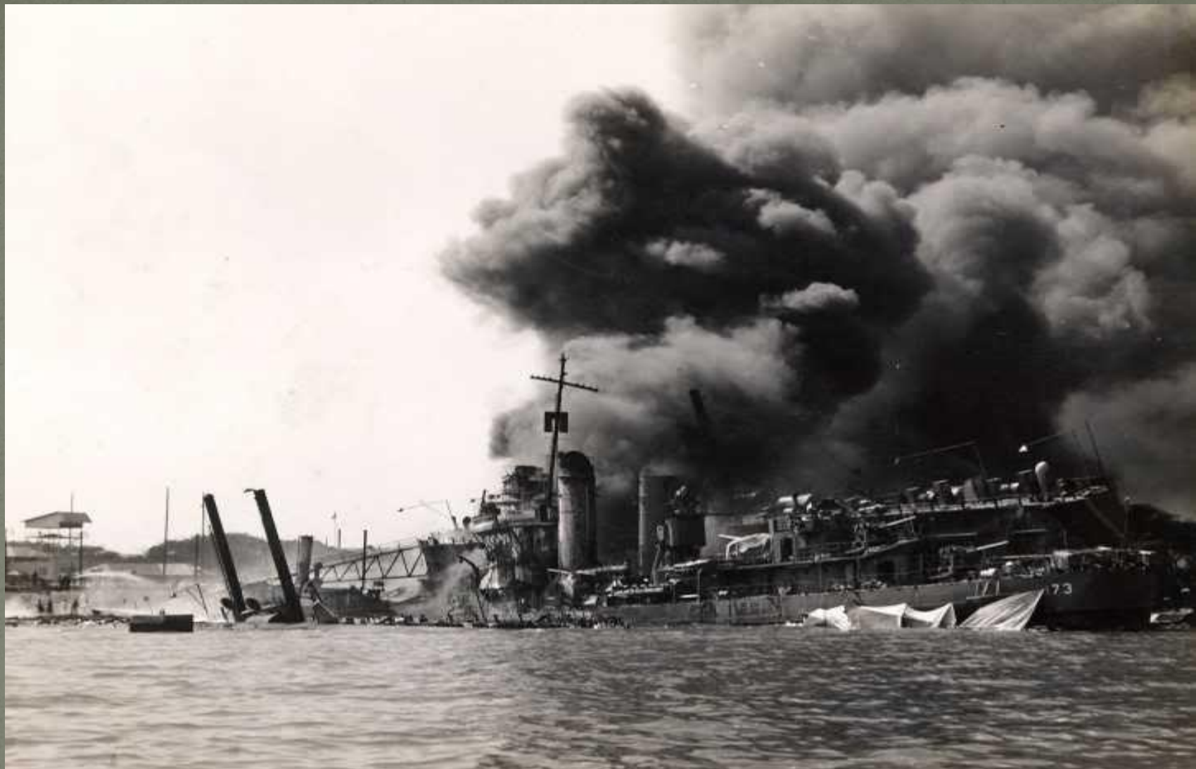
БОМБАРДИРОВКА АМЕРИКАНСКОЙ ВОЕННОЙ БАЗЫ ПЕРЛ - ХАРБОР