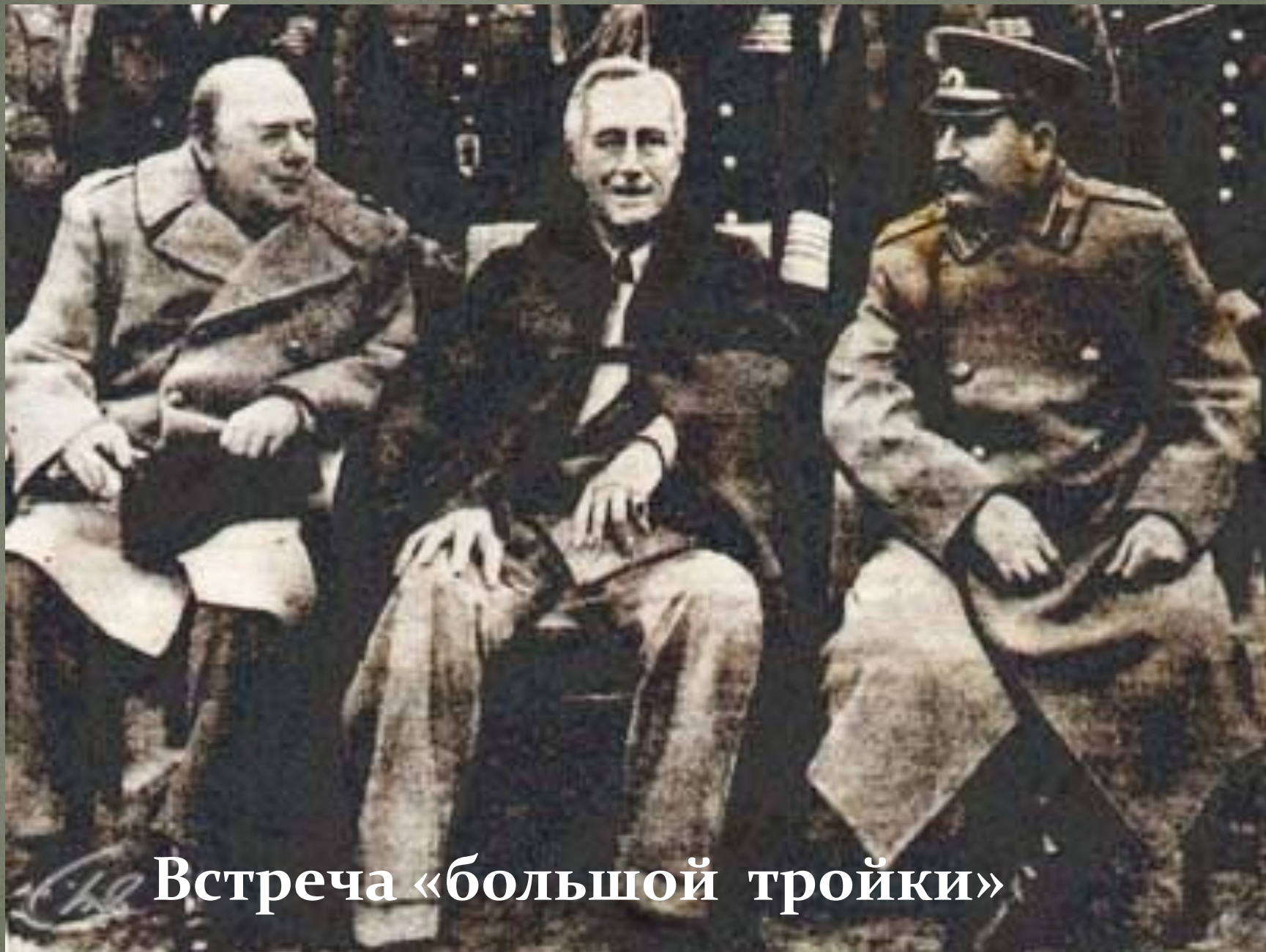
Встреча «большой тройки»