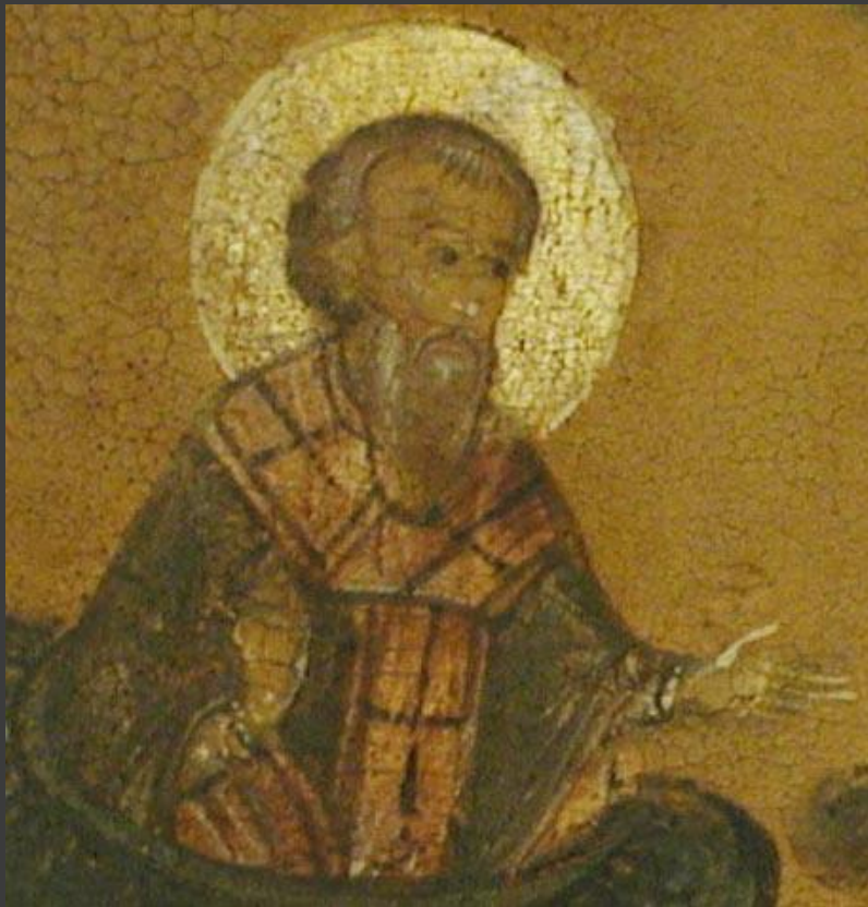
Слово о законе и благодати (митрополит Иларион)