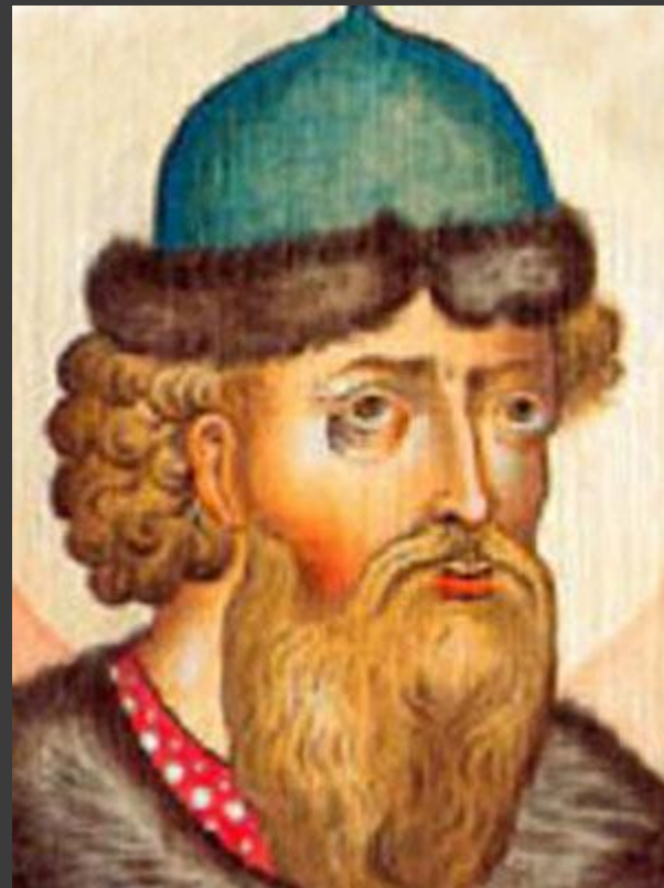
Поучение Владимира Мономаха