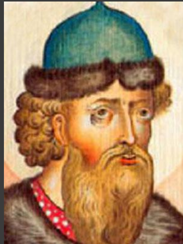
Поучение Владимира Мономаха