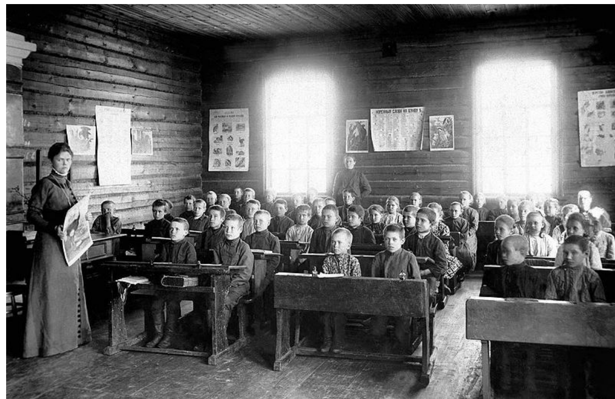
урок в земской школе