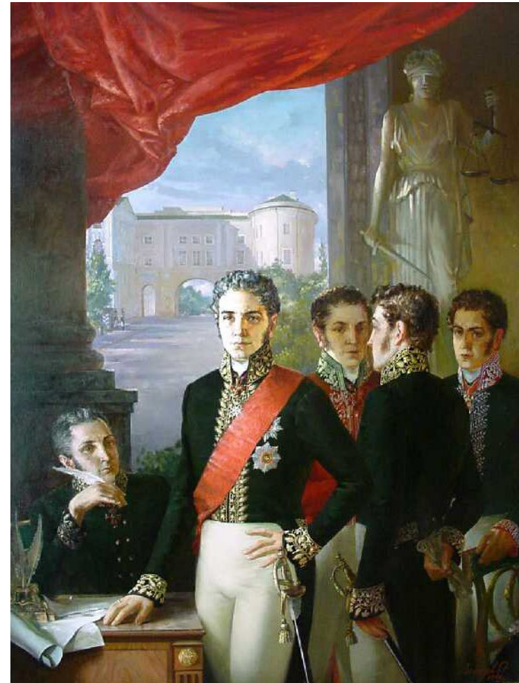
НЕГЛАСНЫЙ КОМИТЕТ, 1998 Олег Леонов