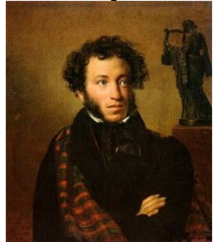
Портрет А.С. Пушкина О.Кипренской, 1828