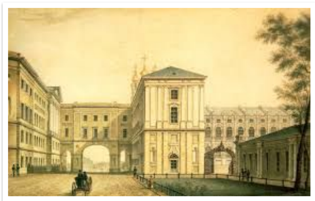
Царскосельский лицей 1811