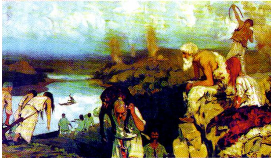
С. В. Иванов. Жизнь восточных славян