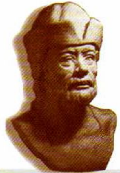
Славянин племени ра- димичей