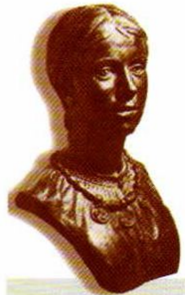
Славянка племени древлян