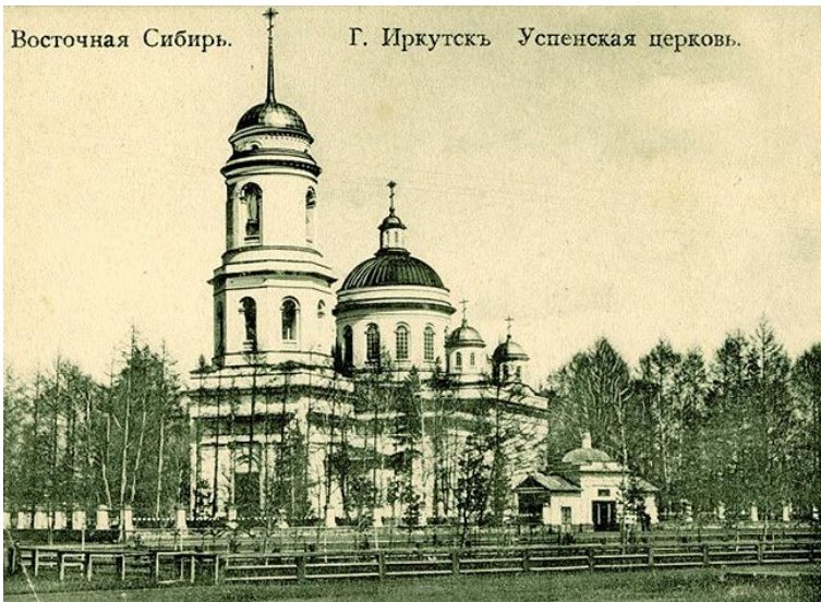
Успенская церковь Вознесенского монастыря

К 1755 г. у монастыря было 52 двора и 464 лица мужского пола. Монастырь оказывал пришлым в Сибирь людям материальную помощь для первоначального обзаведения