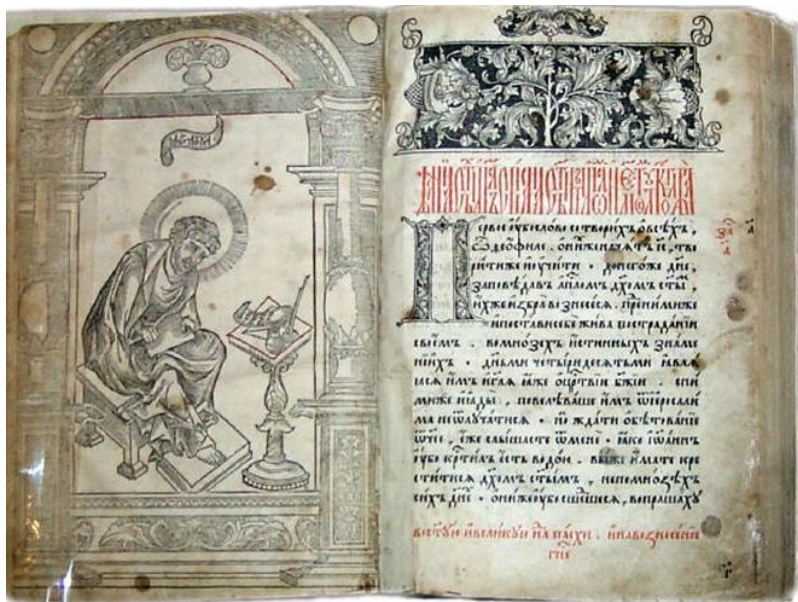
«Апостол» Ивана Федорова, 1564 г.

Землепроходцы привозили и первые книги. Интересно отметить, что в наши дни в одной из деревень на Лене был найден «Апостол», напечатанный Иваном Федоровым