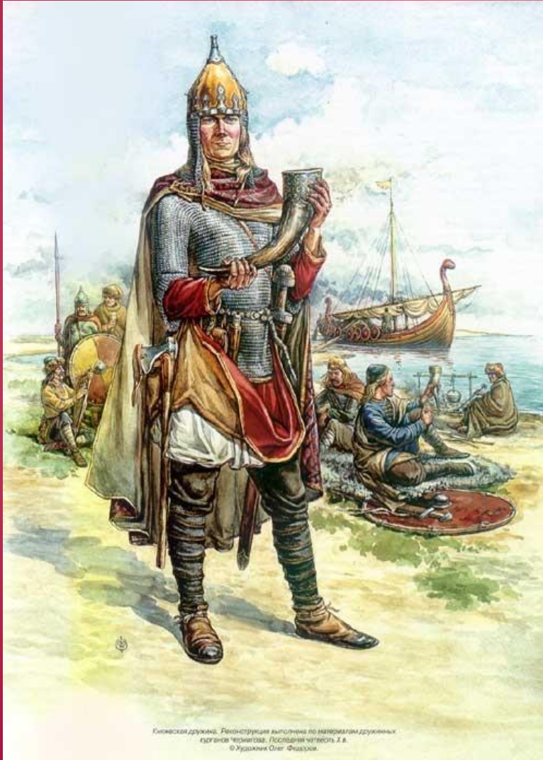
Киевская дружина. Реконструкция выполнена по материалам дружинных курганов Чернигова. Последняя четверть X в. © Журнал «Огонек» Февраль

907 г. – торговый договор, который содержал выгодные для русских купцов условия; 911 г. – первый письменный договор