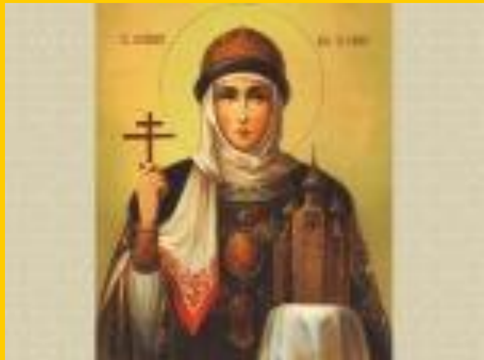
Ольга (945 – 957)