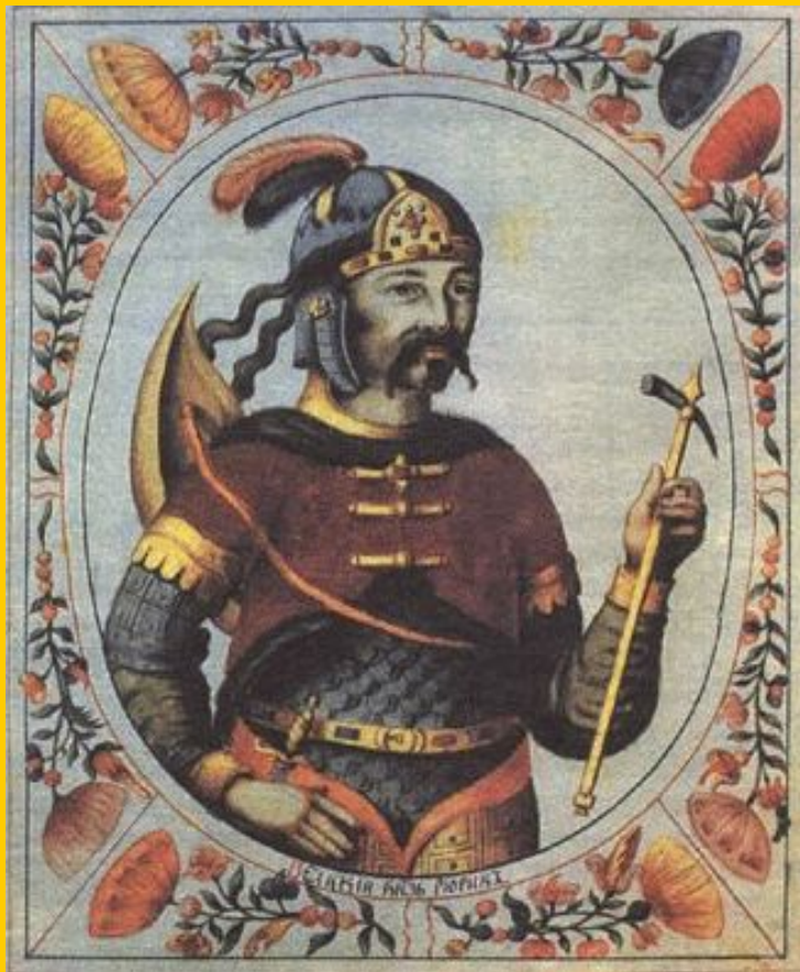
Игорь (912 – 945)