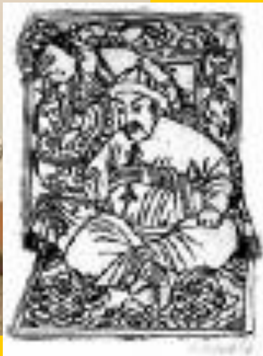
Печенежский князь Кури с черепом Святослава