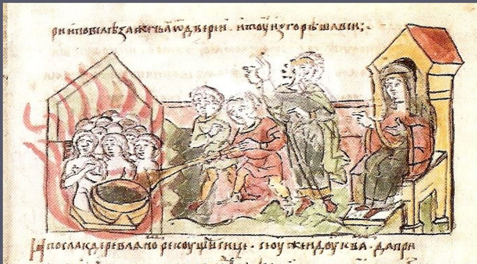
Сожжение вновь пришедших послов в бане