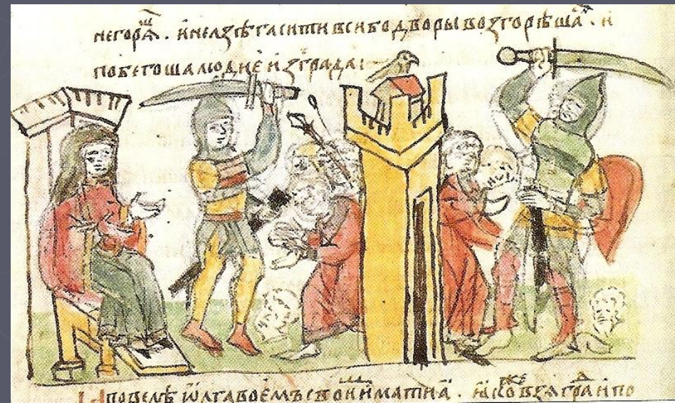
Сожжение древлянского города