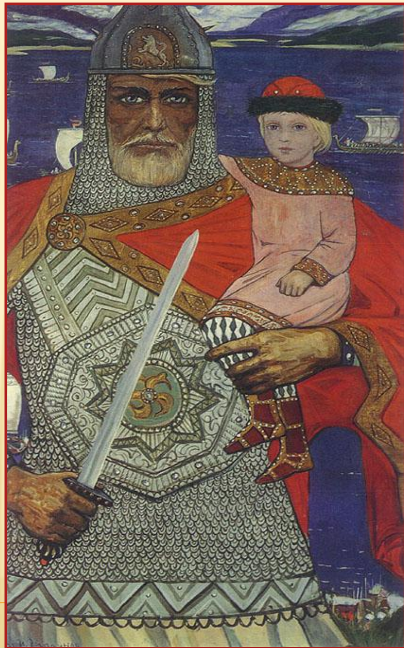
Князь Олег с маленьким Игорем