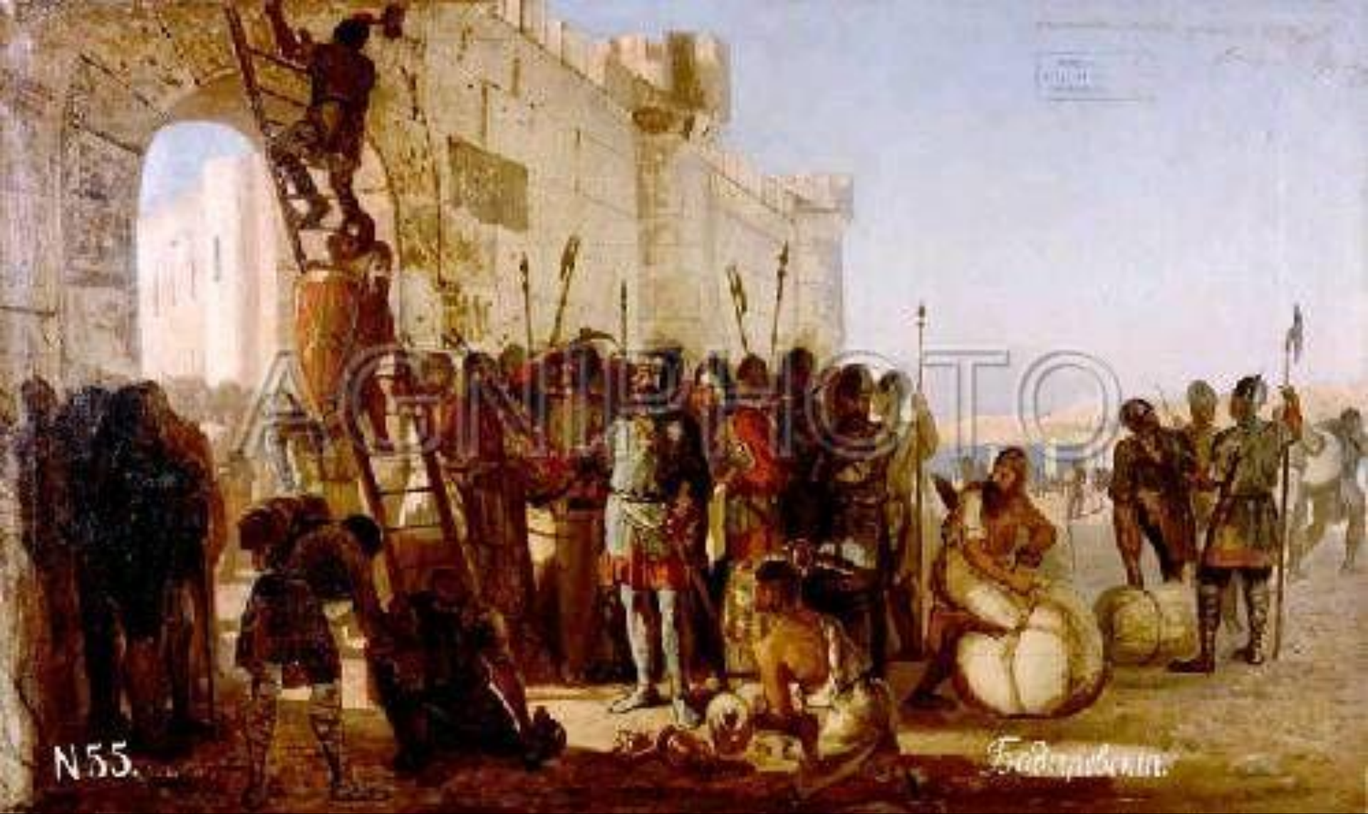
Князь Олег прибывает щит на вратах Царьграда