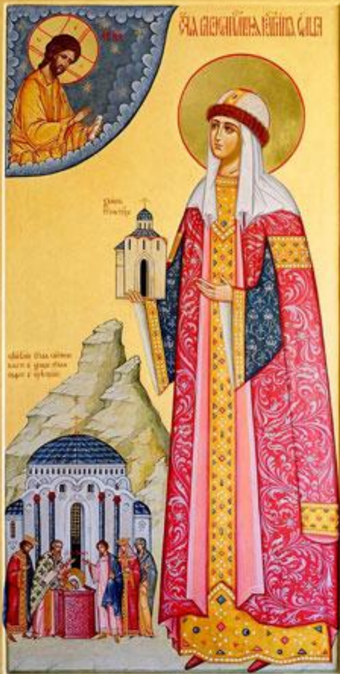
Святая равноапостольная княгиня Ольга. Современная икона