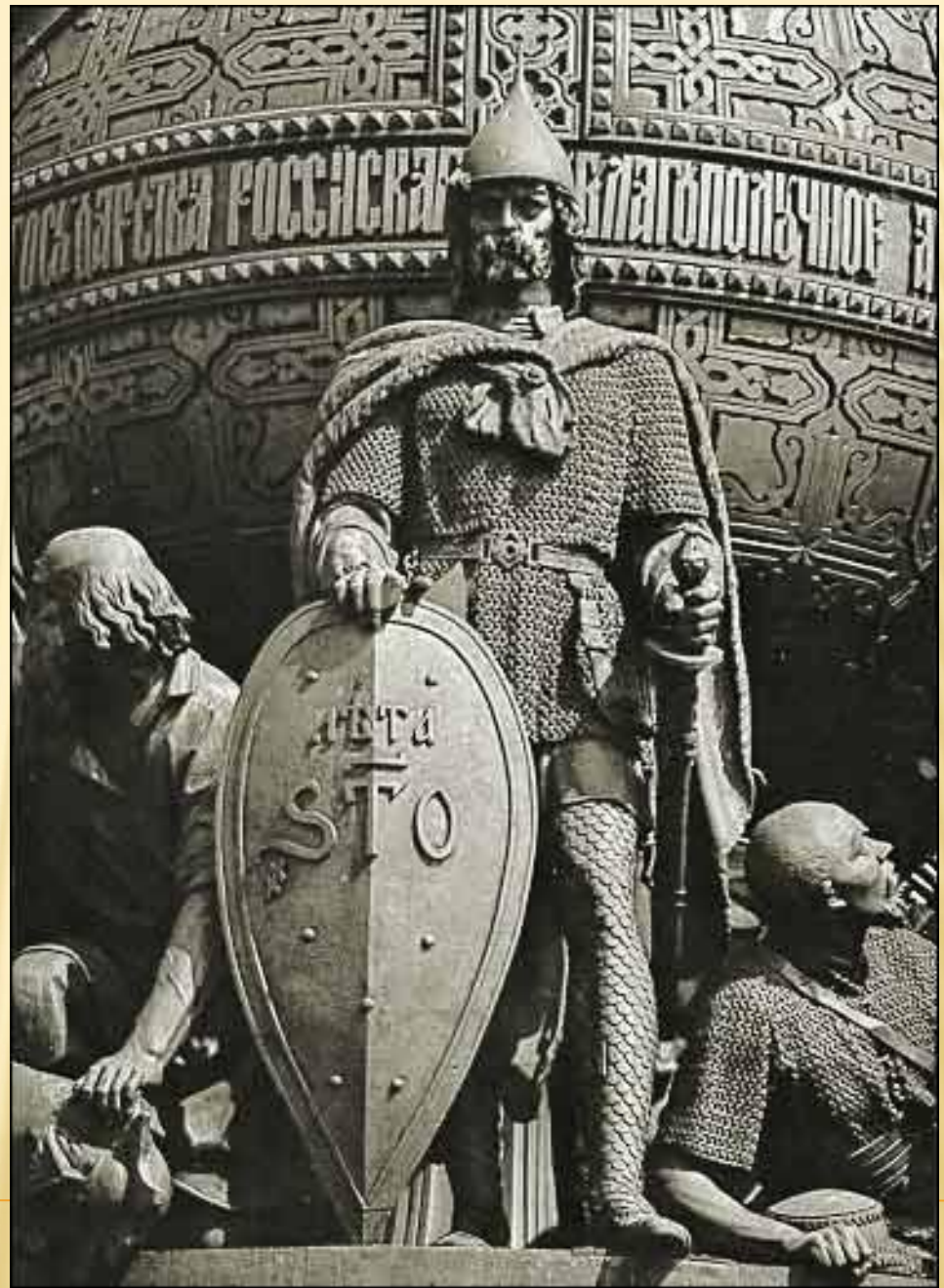
Рюрик - князь земли Новгородской