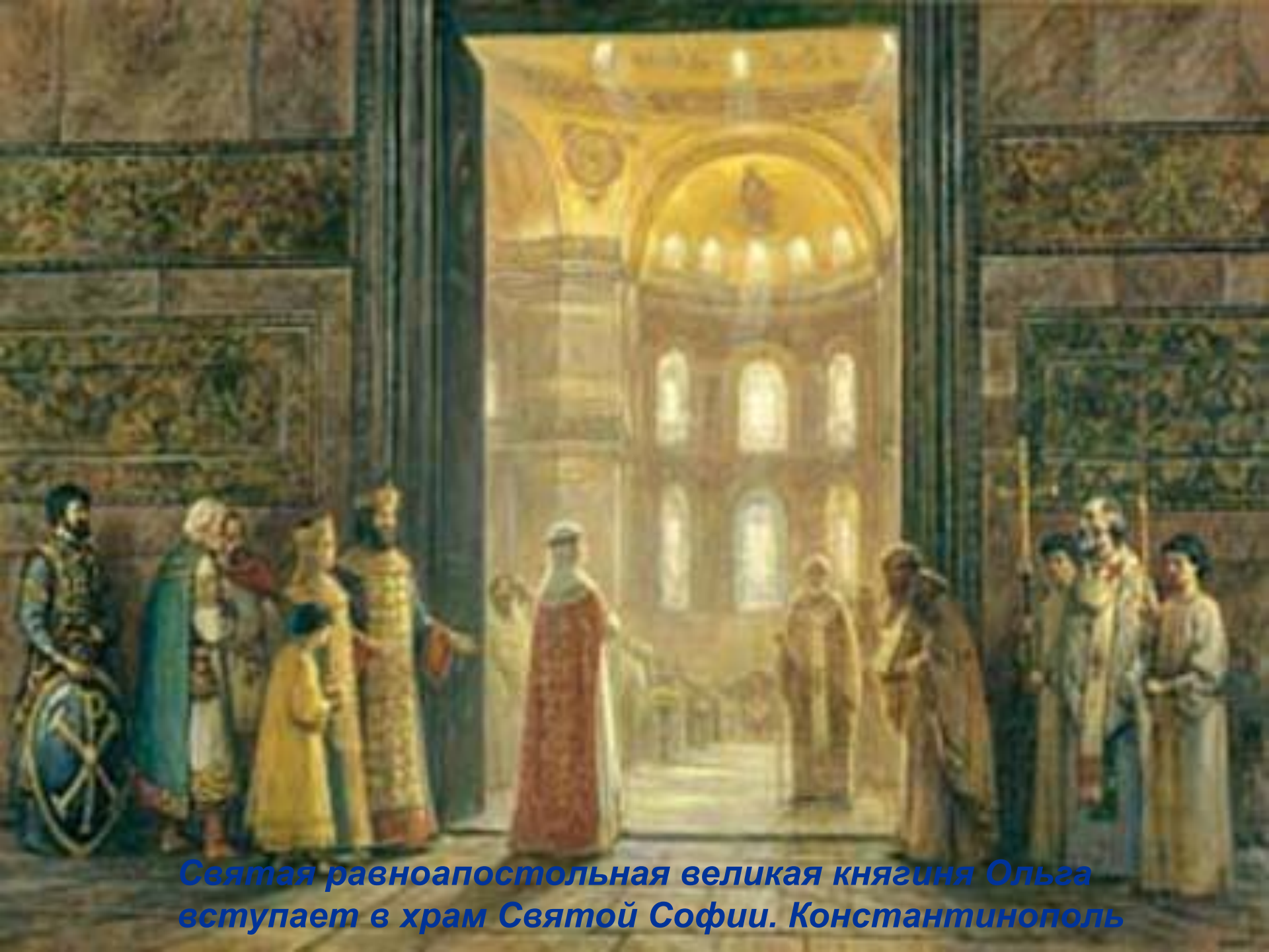
Святая равноапостольная великая княгиня Ольга вступает в храм Святой Софии. Константинополь