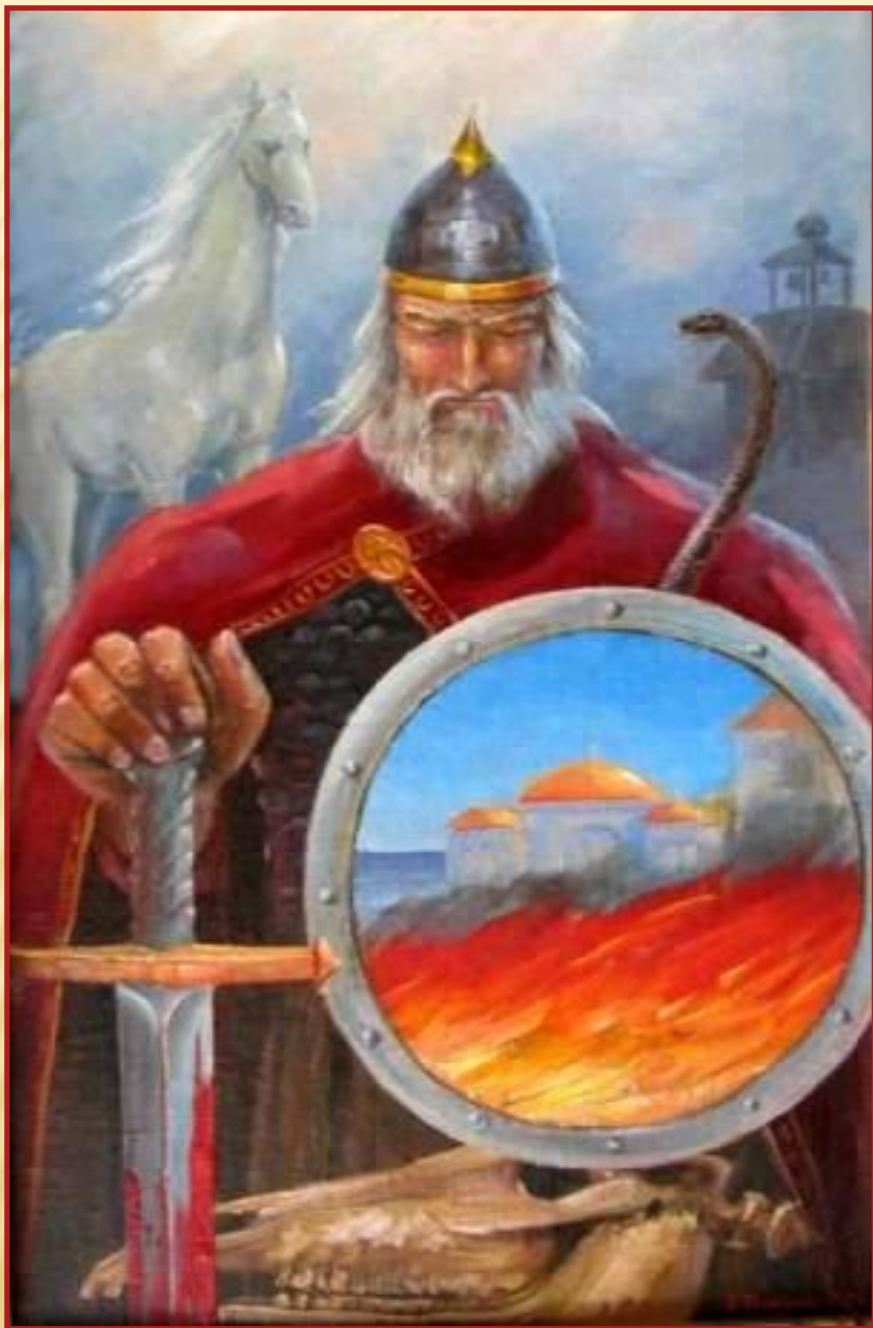
Восхождение князя Олега