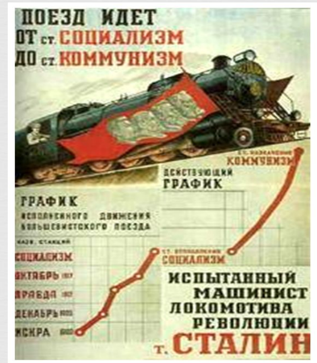
П. Соколов-Скала. «Поезд идет!»