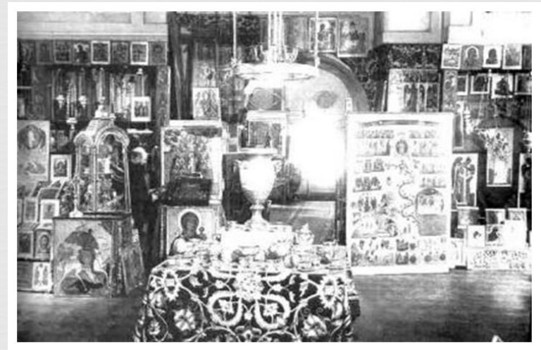
Культурные ценности предназначенные для продажи за границу.