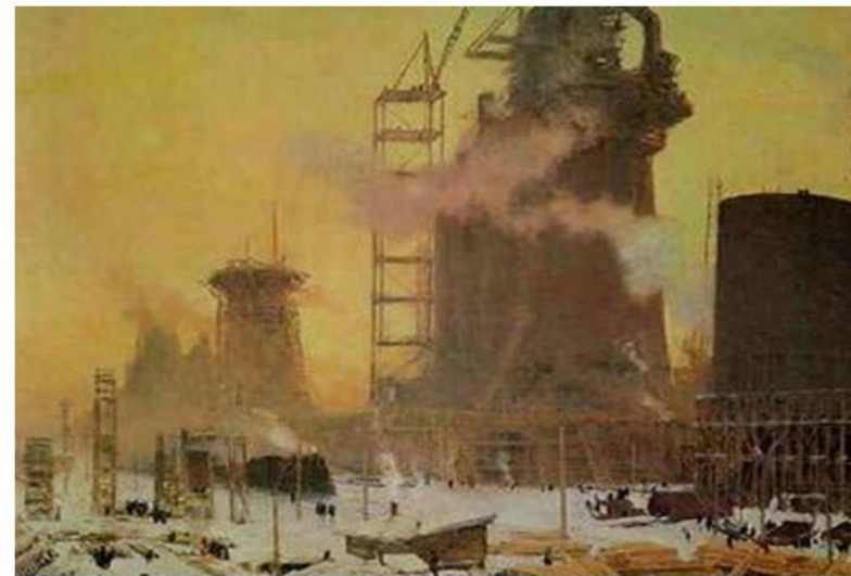
Утро Первой Пятилетки.