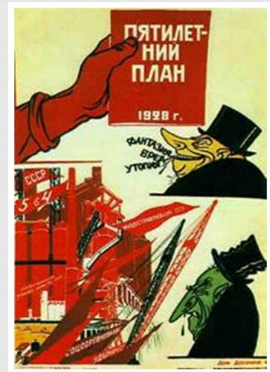
Первый пятилетний план.