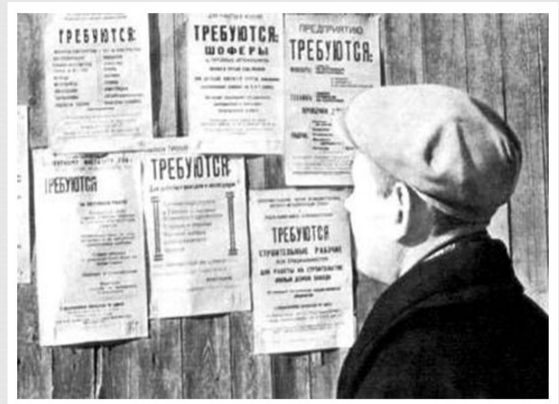
Объявления о наборе рабочих.