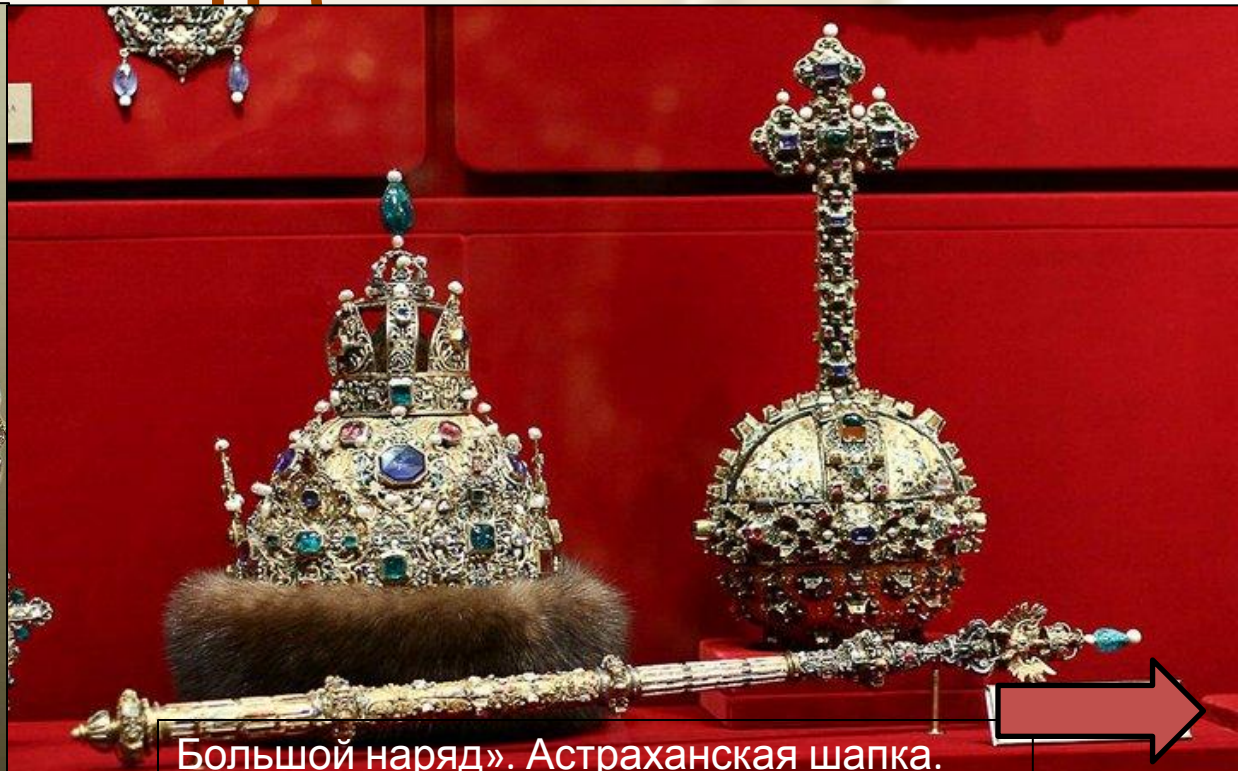
Большой наряд». Астраханская шапка. 1637 г