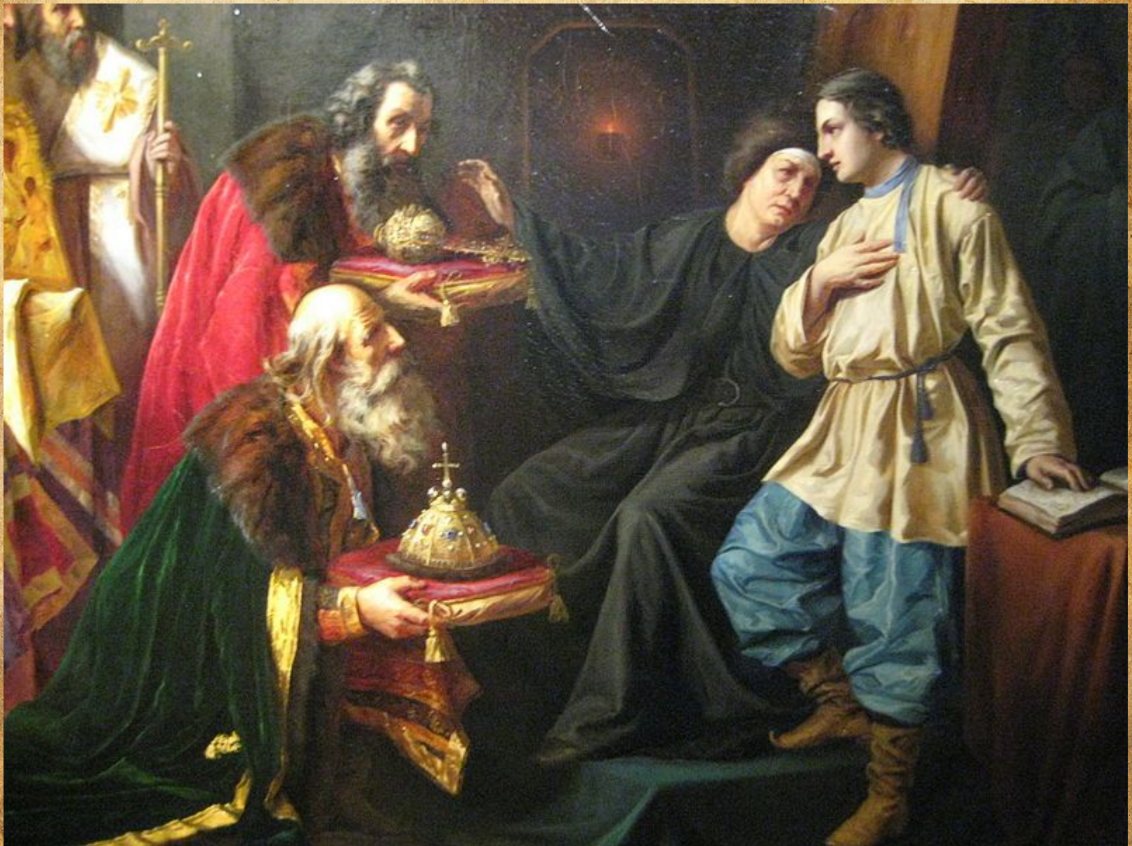
ПРИЗВАНИЕ МИХАИЛА РОМАНОВА НА ЦАРСТВО