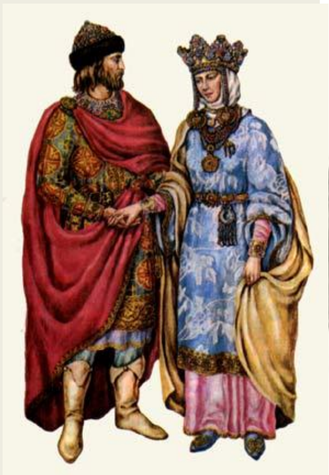
Князь и княгиня времен Киевской Руси