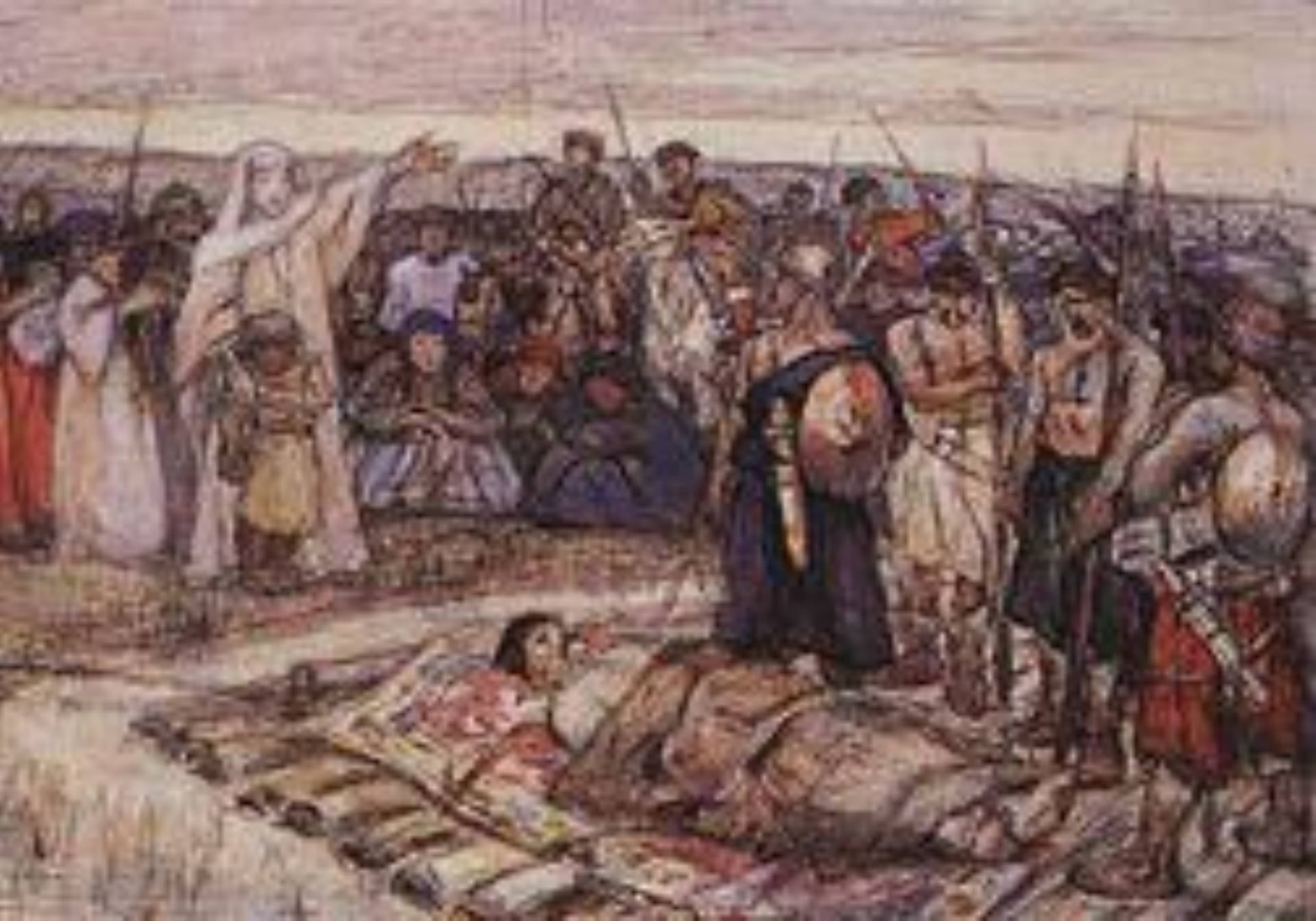
Княгиня Ольга встречает тело Игоря