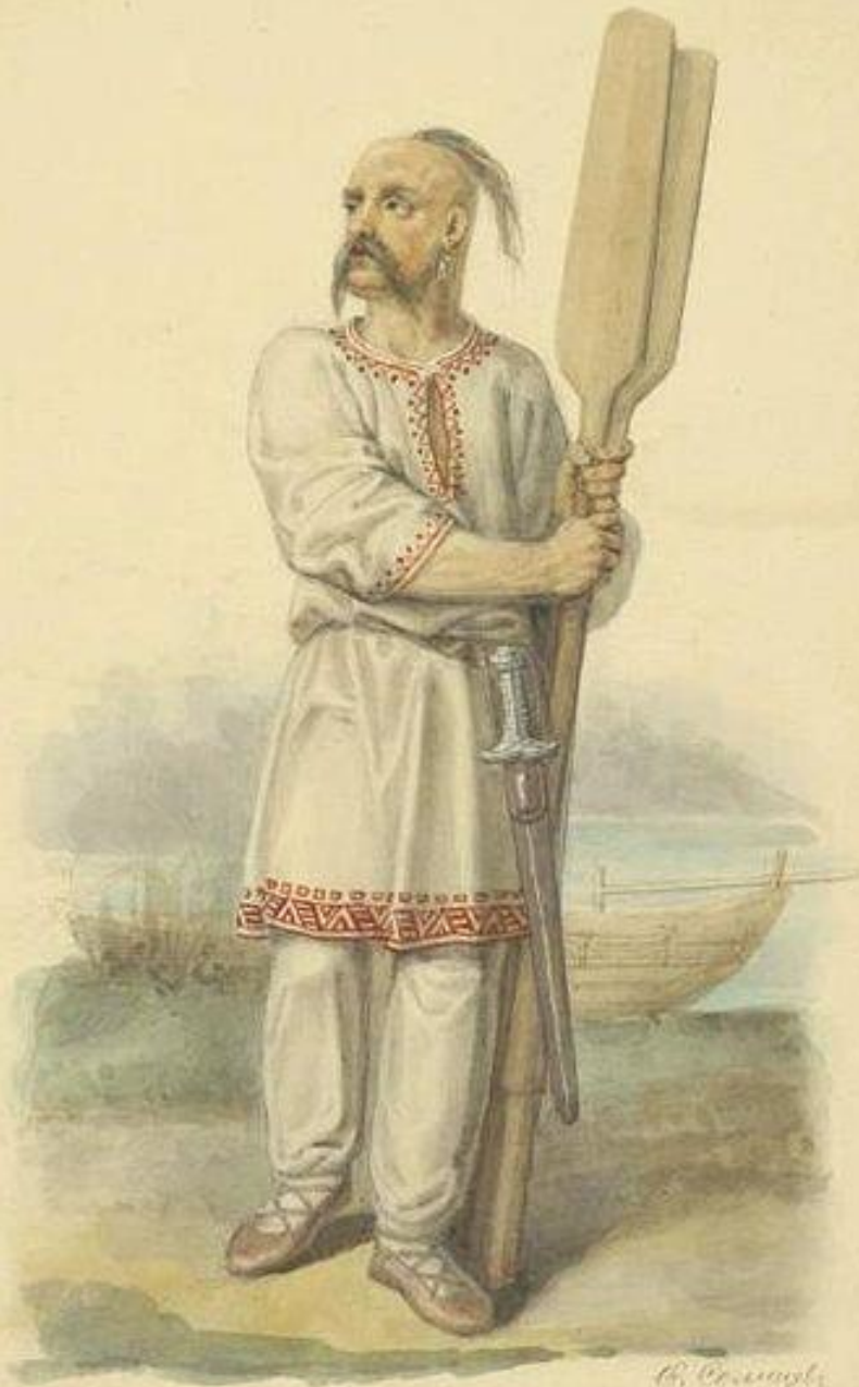
Б.К. СВЯТОСЛАВЪ ИГОРЕВИЧЬ СКОИЧ: 972 Г. (по описанію Льва Діакона)