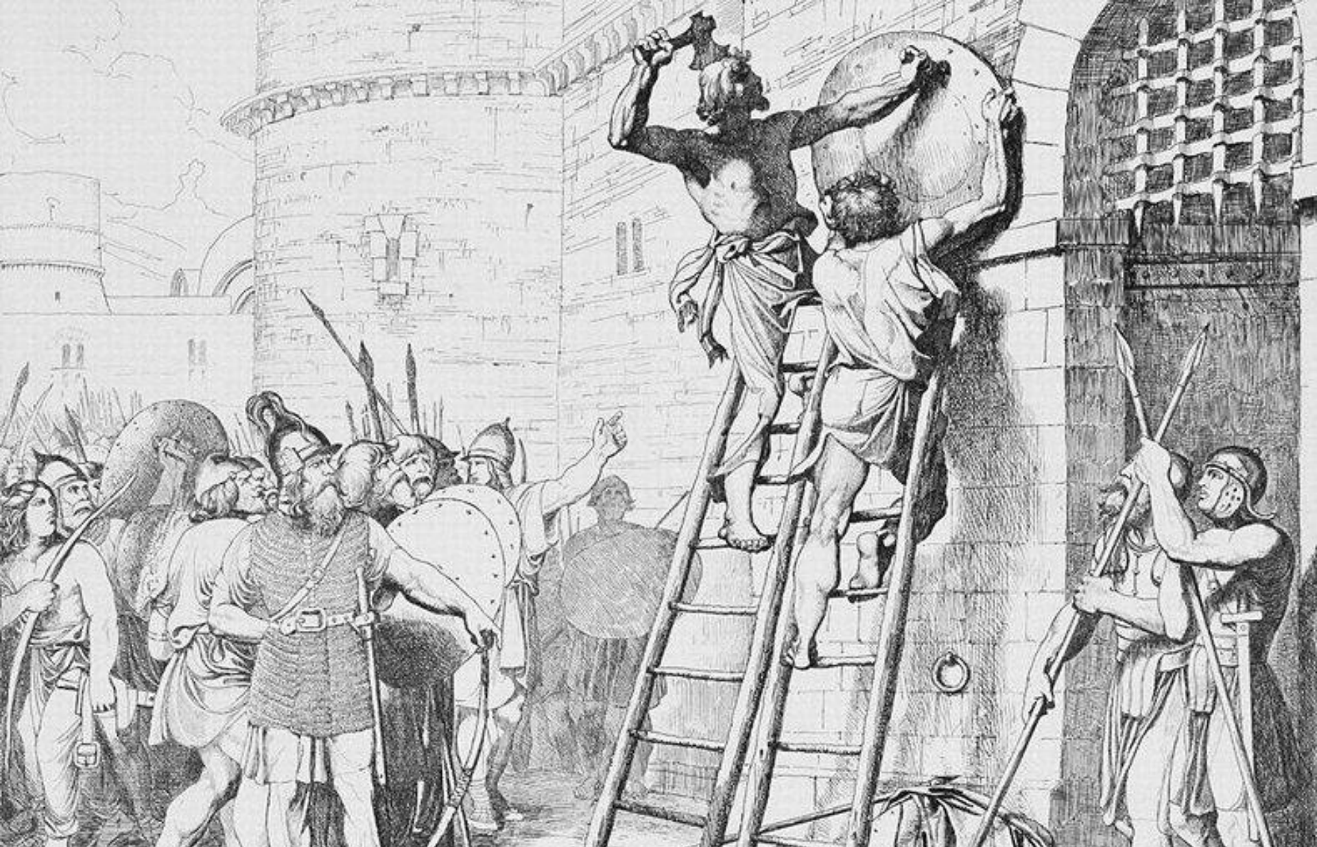
Олег прибывает щит на ворота Царьграда