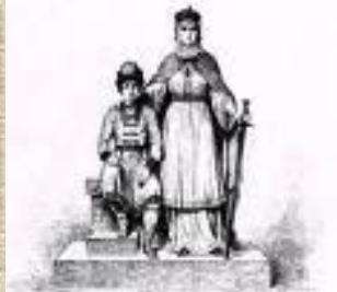
«Скульпры Великий Халарис и Золотой Суды»