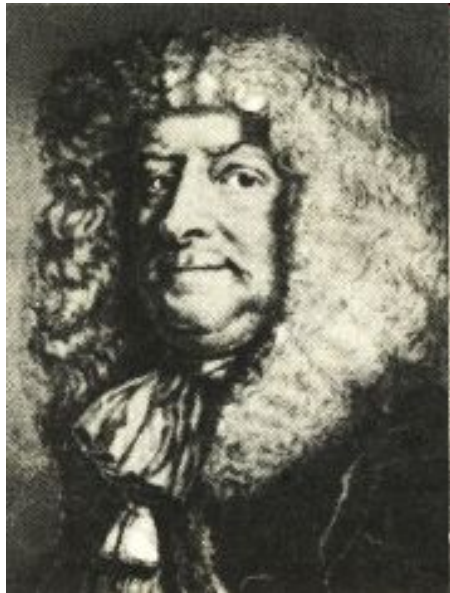
Витус Беринг (1681-1741)

В XVIII в. по инициативе Петра I началось изучение Сибири