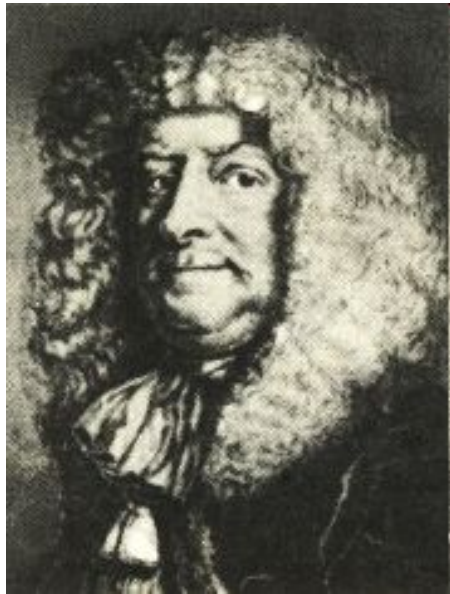
Витус Беринг (1681-1741)

В XVIII в. по инициативе Петра I началось изучение Сибири