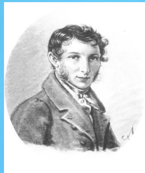
Н.М. Муравьев. Н.И.Тургенев. М.С. Лунин. С. Трубецкой.