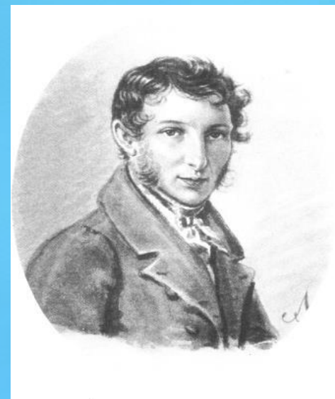
Н.М. Муравьев. Н.И.Тургенев. М.С. Лунин. С. Трубецкой.