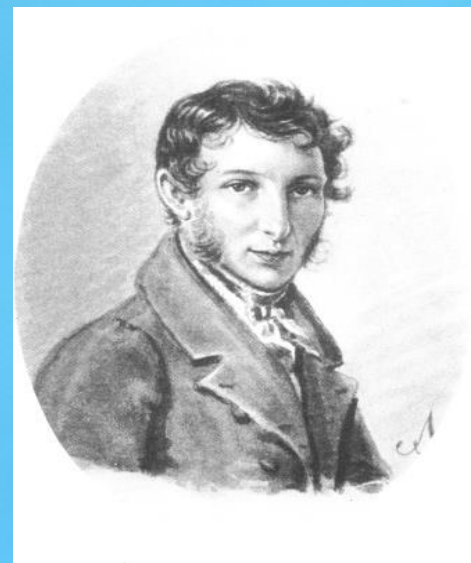
Н.М. Муравьёв. Н.И.Тургенев. М.С. Лунин. С. Трубецкой.