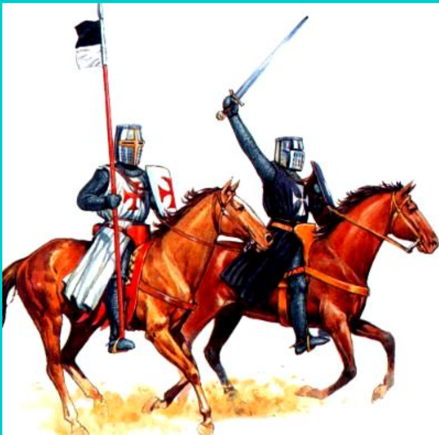
Рыцарь-тамплиер и рыцарь-госпитальер.

Для членов этих орденов были запрещены светские развлечения.