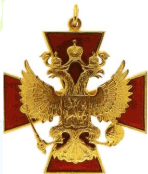
Орден за Заслуги перед Отечеством 1 степени