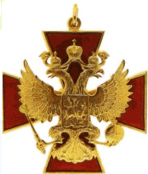
Орден за Заслуги перед Отечеством 1 степени