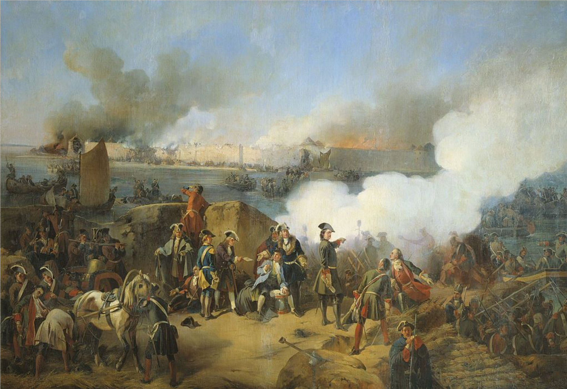
А. Е. Коцебу. «Штурм крепости Нотебург 11 октября 1702 года» (1846)