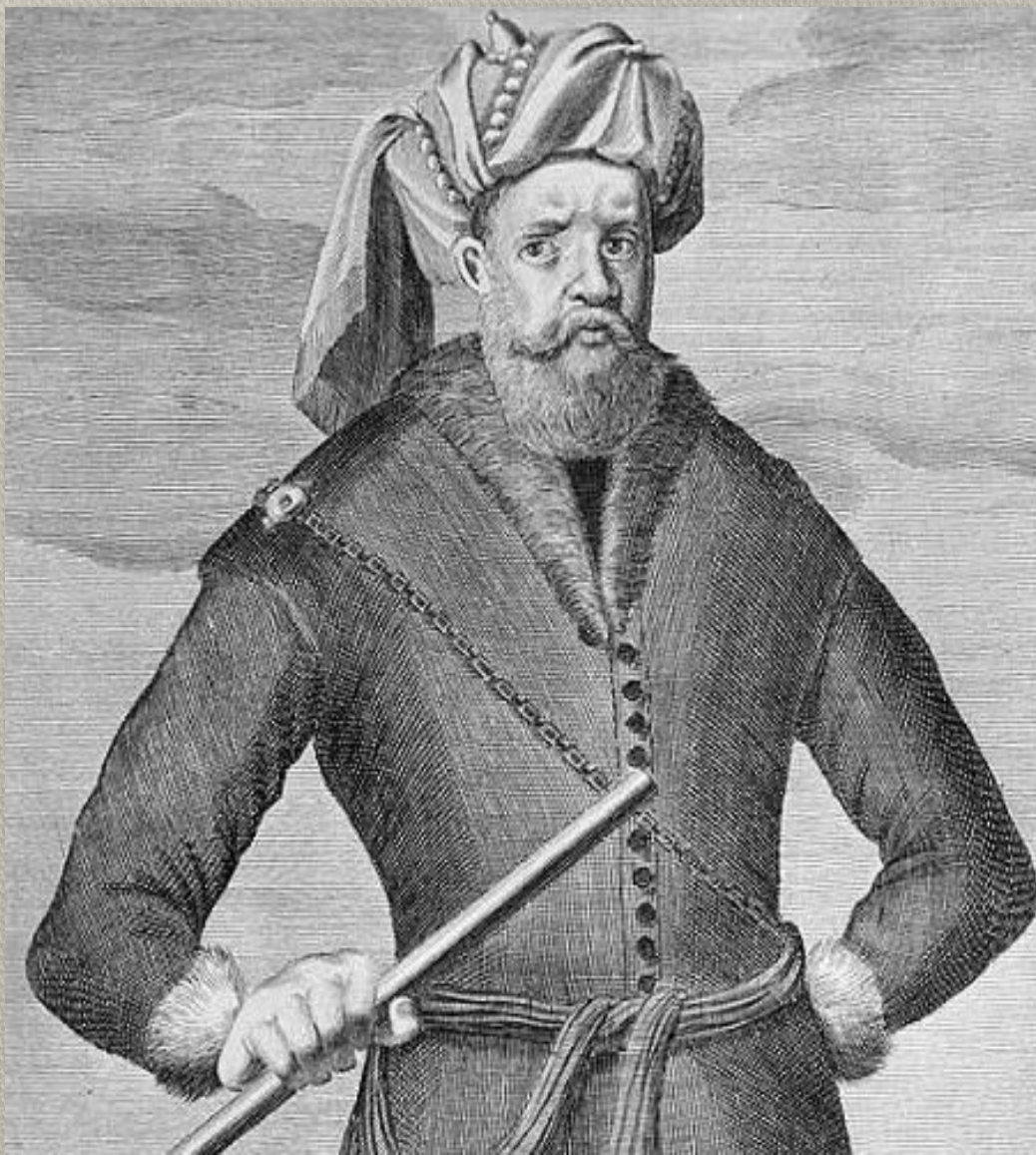
Разин. Фрагмент немецкой гравюры. 1671 г.