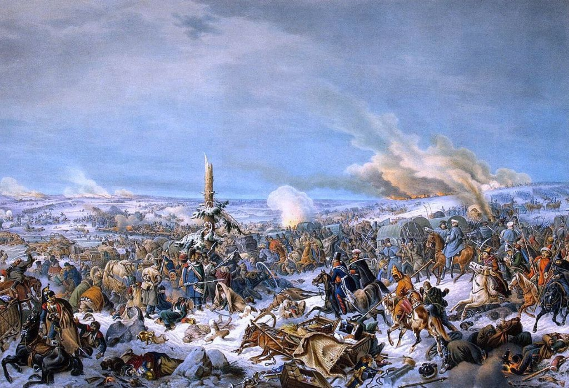
Петер фон Гесс. Переправа через Березину