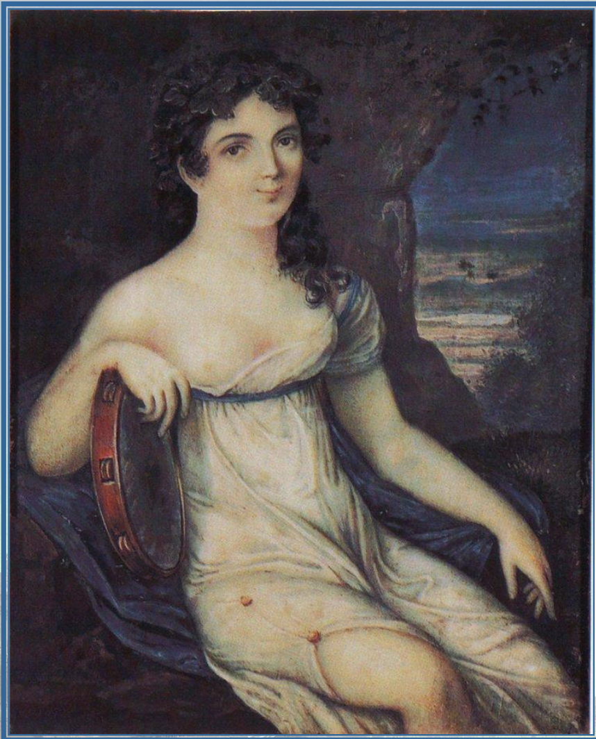
Е. И. Истомина прима балерина петербургского балета

Блистательна, полувоздушна, Смычку волшебному послушна, Толпою нимф окружена, Стоит Истомина; она, Одной ногой касаясь пола, Другую медленно кружит, И вдруг прыжок, и вдруг летит, Летит, как пух от уст Эола; То стан совет, то разовьет, И быстрой ножкой ножку бьет.