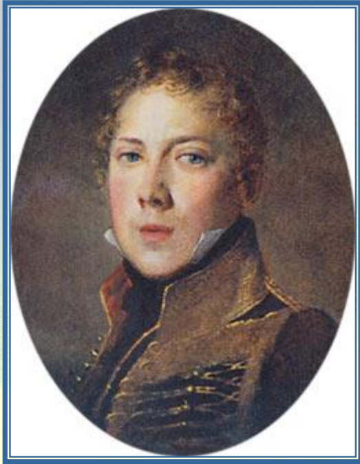
П. Я. Чаадаев

Любовь никак нейдет на ум: Увы! Моя отчизна страждет, Душа в волненьи тяжких дум Теперь одной свободы жаждет.