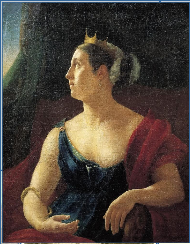
Е. С. Семенова

трагическая актриса Карл Дидло балетмейстер