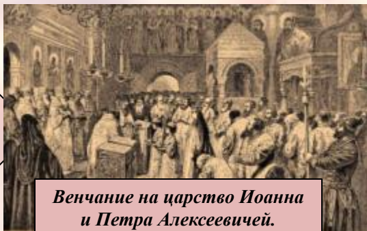
Венчание на царство Иоанна и Петра Алексеевичей.

В результате бунта был политический компромисс: на трон были возведены вместе Иван и Петр.