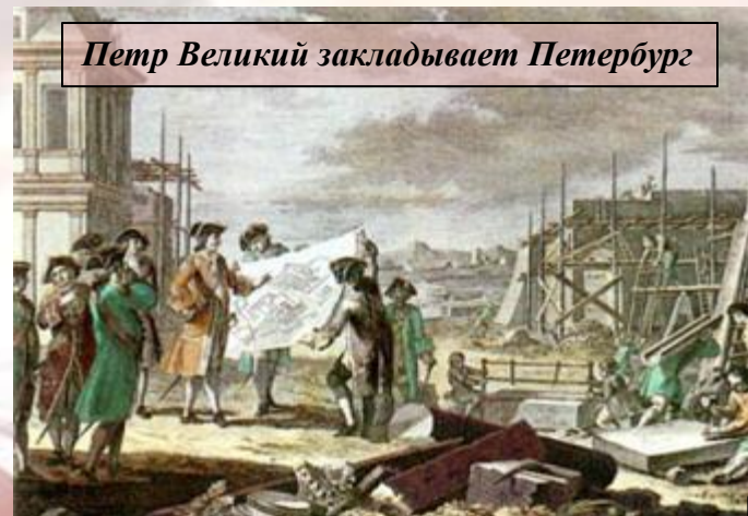
Петр Великий закладывает Петербург