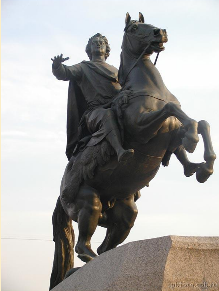
Памятник Петру I в С-Петербурге «Медный всадник» Скульптор - Э.Фальконе (1768-1770гг.)

Петр I - эпохальная личность, при нем Россия стала Империей , а царь – Императором .