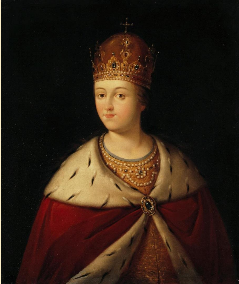
Портрет царевны Софьи

В 1682 году умер царь Фёдор Алексеевич. 10-летний Петр и его сводный 16-летний брат Иван V были провозглашены царями. Иван был очень болезненным, Пётр – слишком юным, поэтому государственными делами заправляла их старшая сестра – царевна Софья Алексеевна .