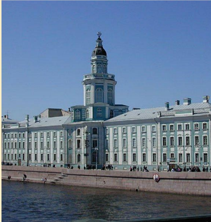
Здание Кунсткамеры С-Петербург, Университетская наб., д.3

При Петре I возникли первые военные и профессиональные школы, училища, гимназии и Академия наук .