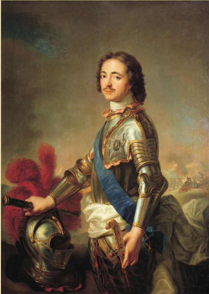
Портрет Петра I в рыцарских доспехах Художник - Натъе Жан Марк (1717г.)

Ко времени прихода Петра I к власти Россия была страной с огромной территорией, но не имела выхода к морю.