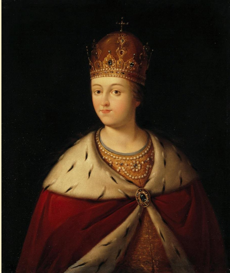
Портрет царевны Софьи

В 1682 году умер царь Фёдор Алексеевич. 10-летний Петр и его сводный 16-летний брат Иван V были провозглашены царями. Иван был очень болезненным, Пётр – слишком юным, поэтому государственными делами заправляла их старшая сестра – царевна Софья Алексеевна .