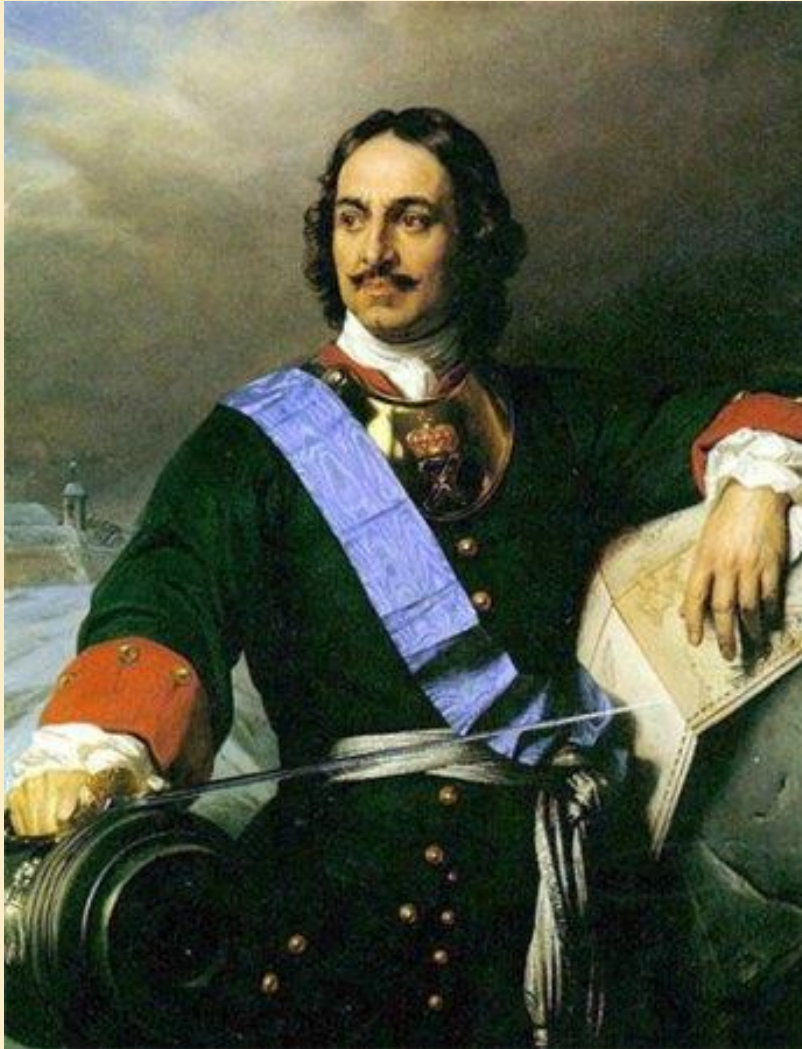
Портрет Петра I Художник - Поль Деларош (1838г.).

В 1721 году Сенат за выдающиеся заслуги присвоил царю титул