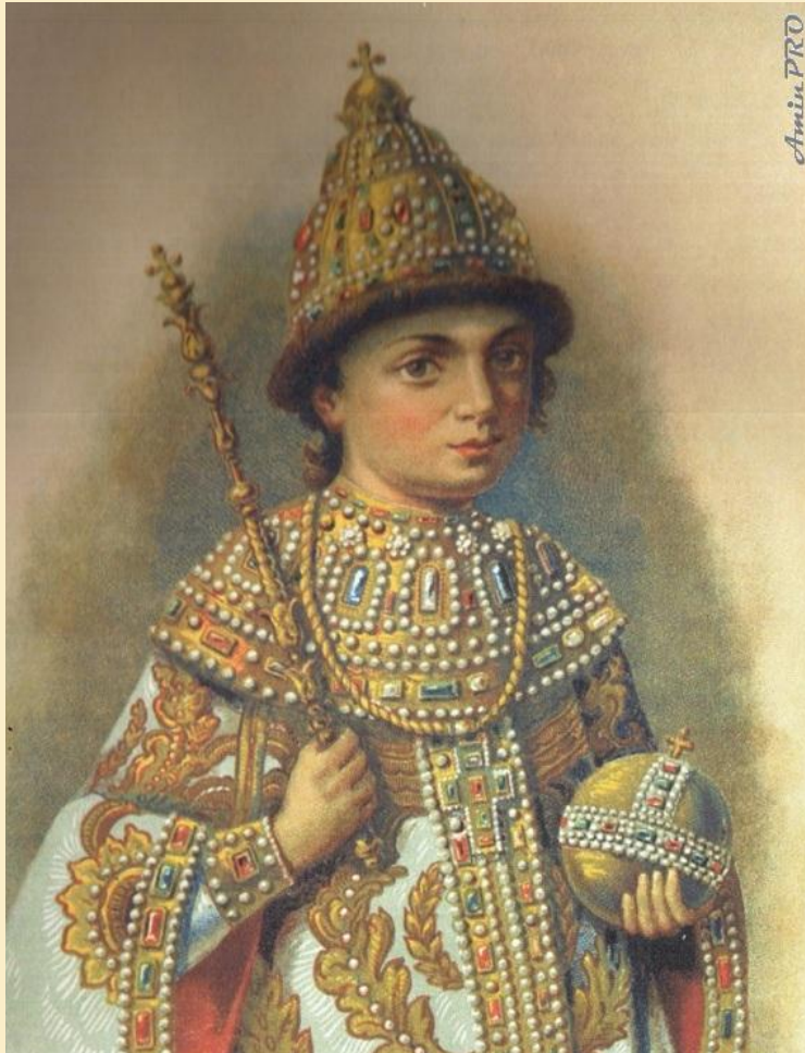
Портрет юного Петра I Неизвестный автор

Будущий император родился 30 мая (9 июня) 1672 года в Москве. Он был младшим сыном царя Алексея Михайловича Романова от второго брака с царицей Натальей Кирилловной Нарышкиной .