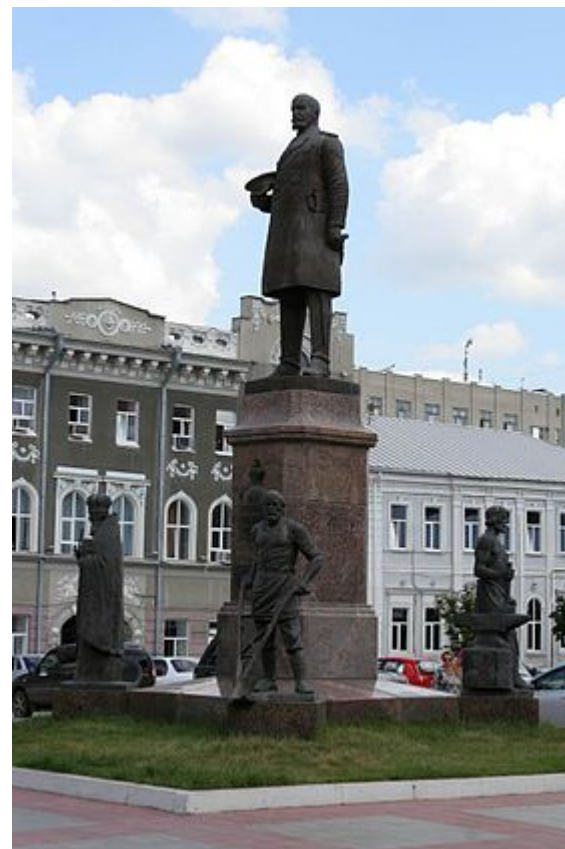
Памятник в Саратове на площади Столыпина.

26 мая 2008 года Правительство РФ учредило медаль Столыпина П. А. 2х степеней.