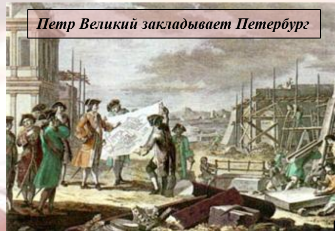
Петр Великий закладывает Петербург