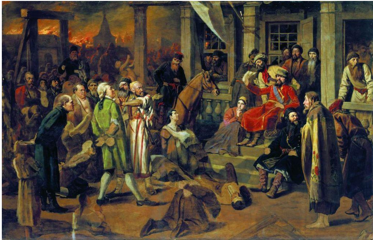
В. Перов. Суд Пугачева