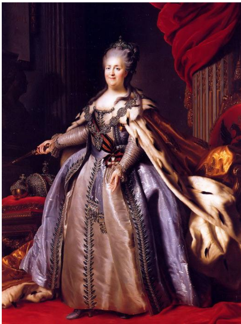
Ф. Рокотов. Екатерина II