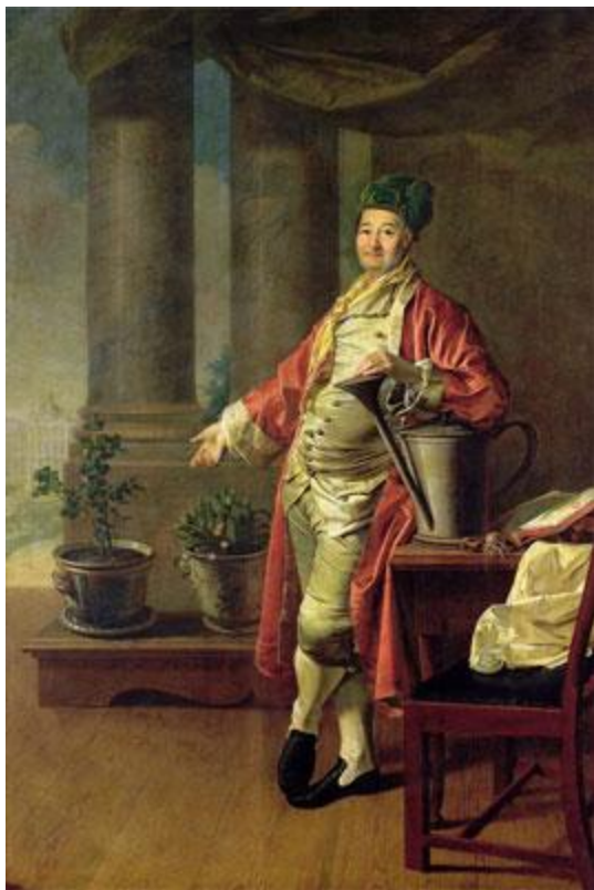
Д.Левицкий. Портрет Демидова, А. Рослин, портрет И. Бецкого

4. Распространение знаний, развитие европейских форм культуры и образования