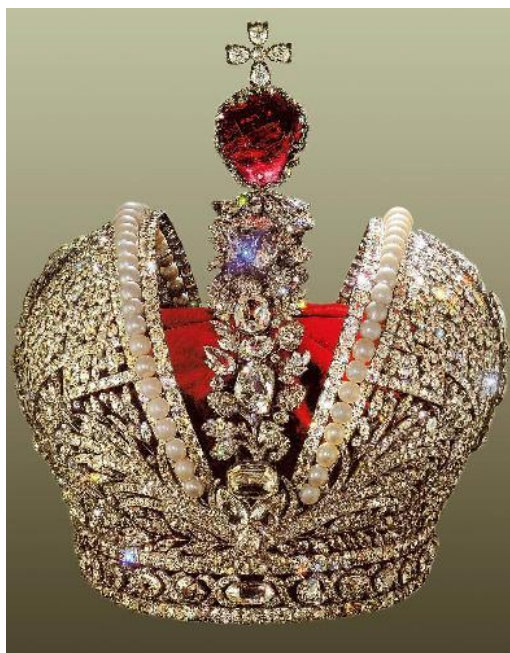
Большая императорская корона, регалия с 1762 по 1917 г.

3. Укрепление самодержавия, модернизация системы управления