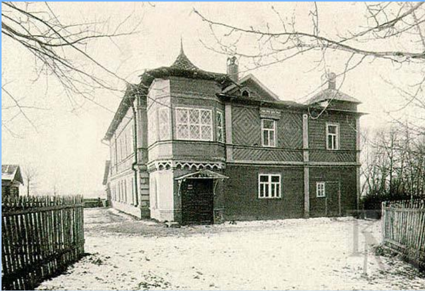
Дом П. И. Чайковского в Клину. 1893 год.

В 1892 году обосновался в Клину, под Москвой