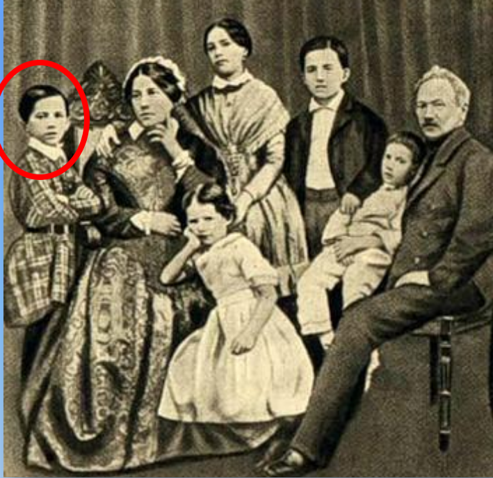
Семья Чайковских в 1848 году (крайний слева — Пётр Ильич)

Родился 25 апреля 1840 года в селении при Камско - Воткинском заводе Вятской губернии (ныне город Воткинск, Удмуртия). Пётр был вторым ребёнком в семье.