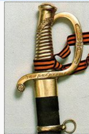
Эфеэ наградной золотой сабли. Хорошо видна надпись «За храбрость» на гарде