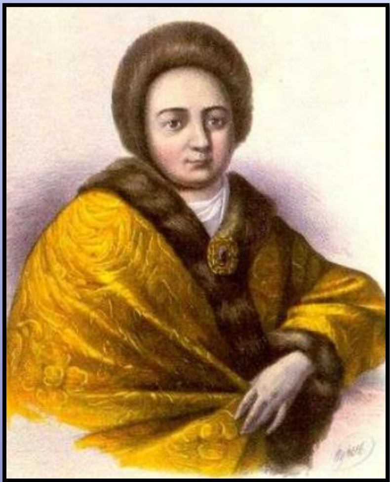
Наталья Кирилловна Нарышкина – мать Петра I