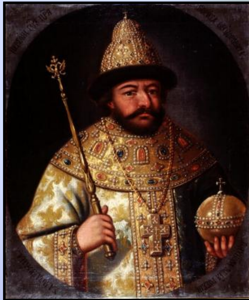
Царь Алексей Петрович Романов – отец Петра I