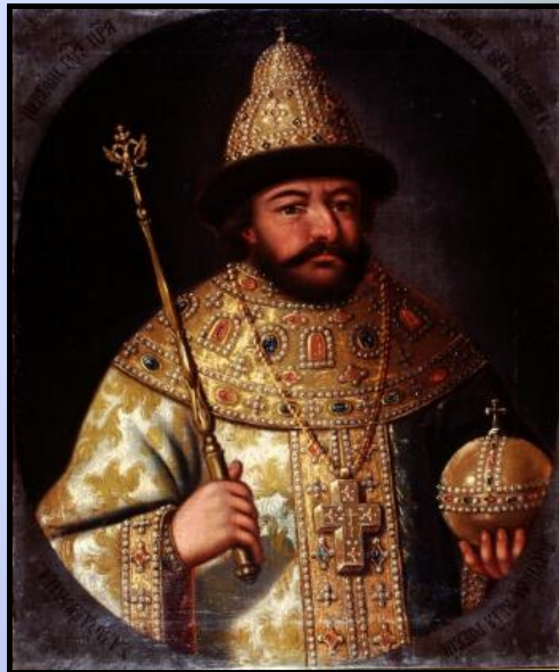
Царь Алексей Петрович Романов – отец Петра I