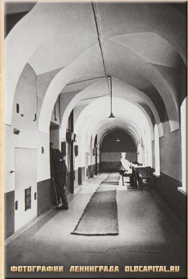
ФОТОГРАФИИ ЛЕНИНГРАДА