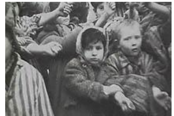
Юные узники Освенцима