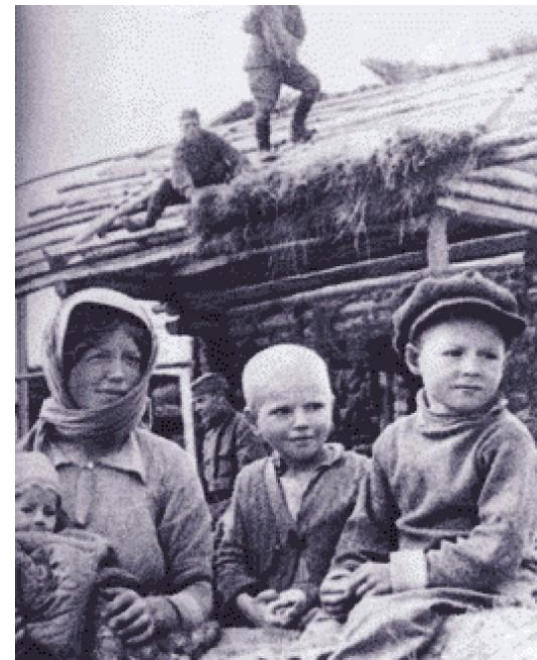
Дети из деревни Лозоватка