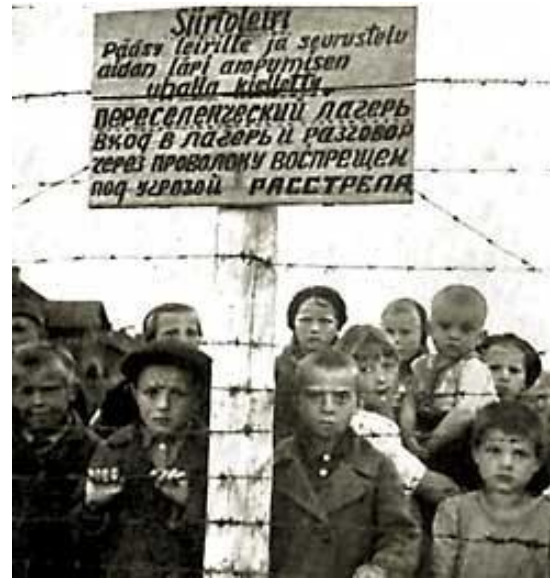
Узники фашизма в Карелии, г. Петрозаводск