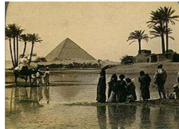
Пирамида Хеопса в XIX веке