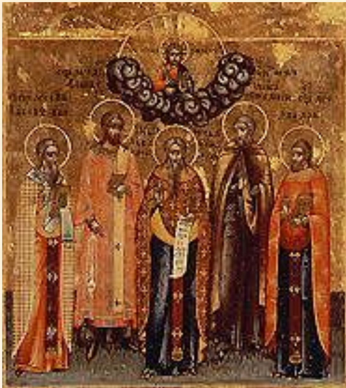
Священномученик Аввакум (в центре) с избранными СВЯТЫМИ. Старообрядческая икона. 18 в.