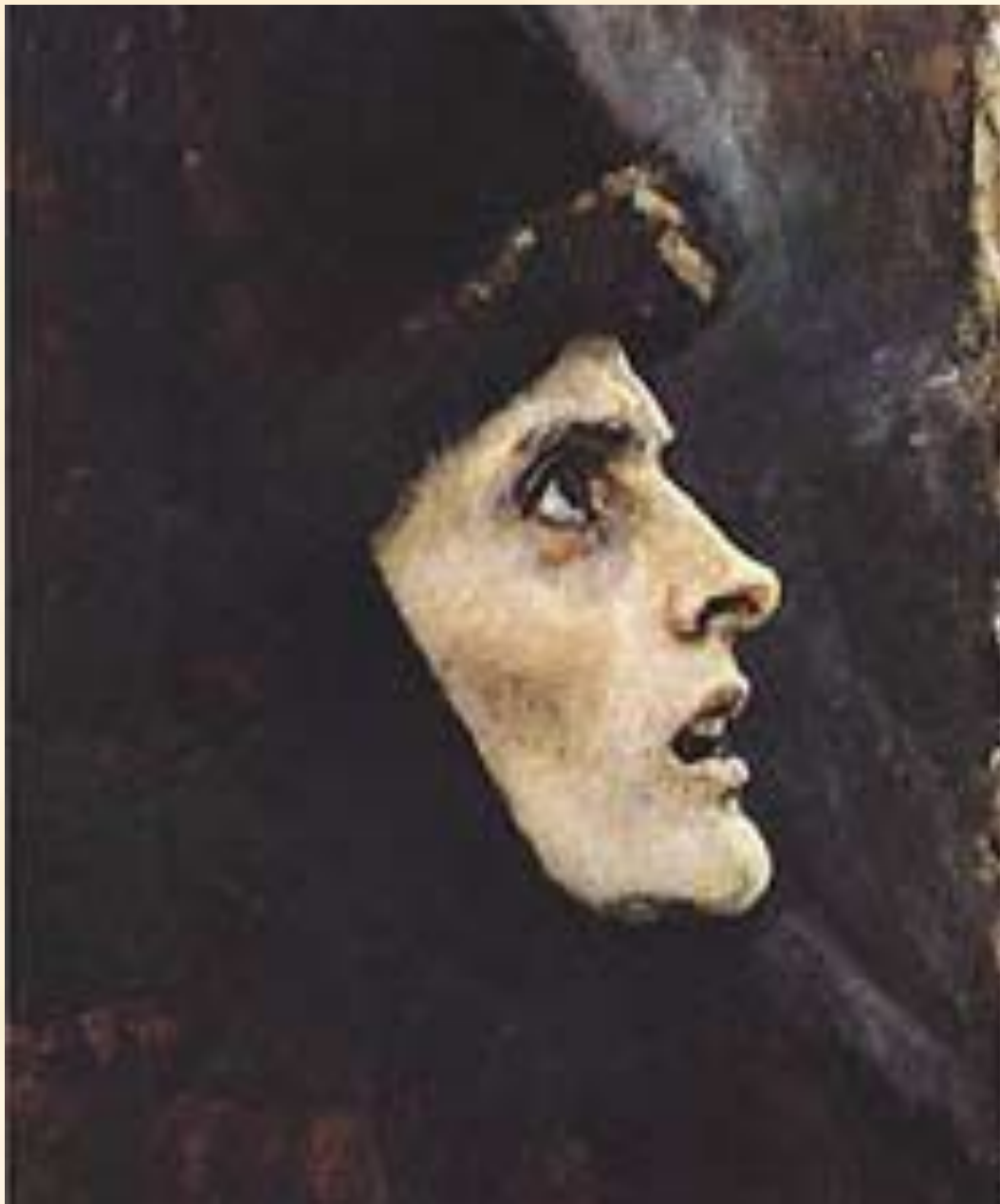
В. И. Суриков. Голова боярыни Морозовой. 1886 год.