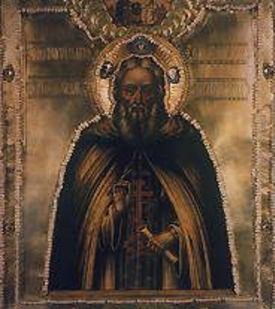
Икона «Преподобный Сергий Радонежский». 18 в.