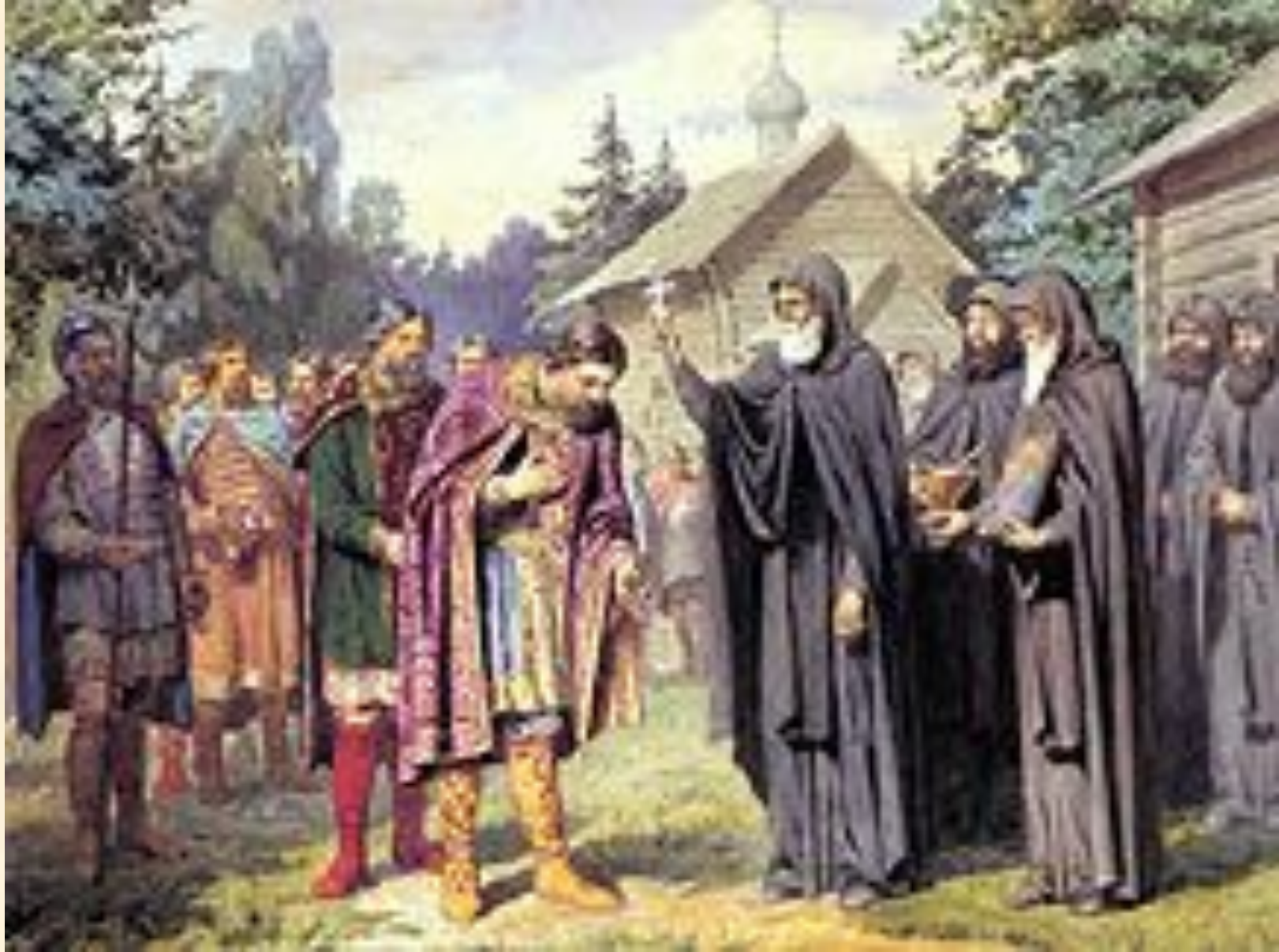
А. Д. Кившенко. «Посещение великим князем Дмитрием Сергия Радонежского перед выступлением в поход на татар. 1380 год». 1880.