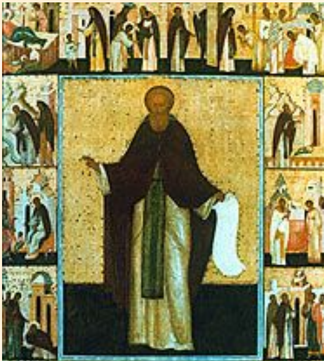
Дионисий. Деяния Сергия Радонежского. Икона из Успенского собора в Дмитрове. Вторая половина 15 века.