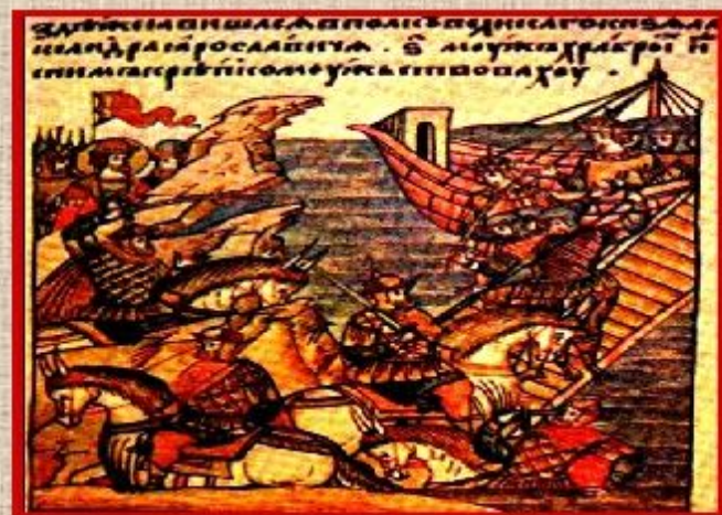
Миниатюра из рукописной книги.

Письменность у восточных славян зародилась до принятия христианства. Славянскую азбуку создали византийские монахи Кирилл и Мефодий. При церквях и монастырях были открыты школы. Появляются первые рукописные книги.