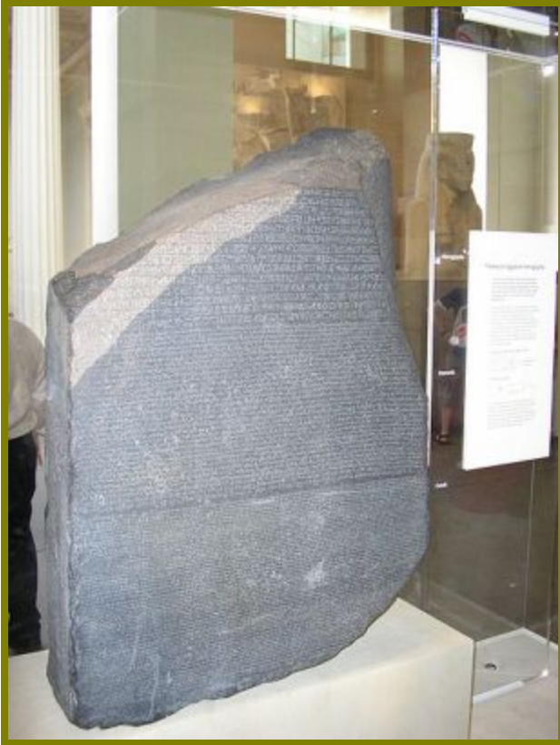
Розеттский камень. С 1802 г. хранится в

15 июля 1799 группе французских солдат под командованием капитана Пьера-Франсуа Бушара при сооружении форта Сен-Жюльен близ города Розетты была обнаружена каменная плита с выбитыми на ней тремя идентичными по смыслу текстами (два текста на древнеегипетском языке и один на древнегреческом языке).