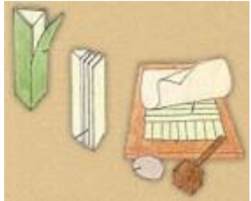
Процесс изготовления папируса В III ст. до н.э. техника изготовления папируса достигла высокого уровня.