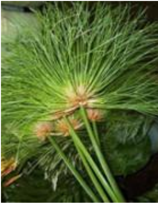
Стебли папируса Папирус – водный травяной цветок