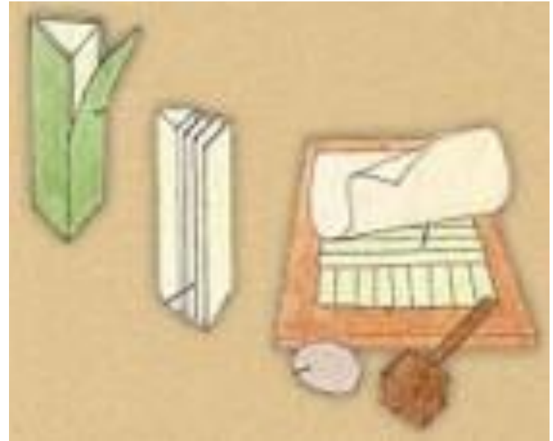
Процесс изготовления папируса В III ст. до н.э. техника изготовления папируса достигла высокого уровня.