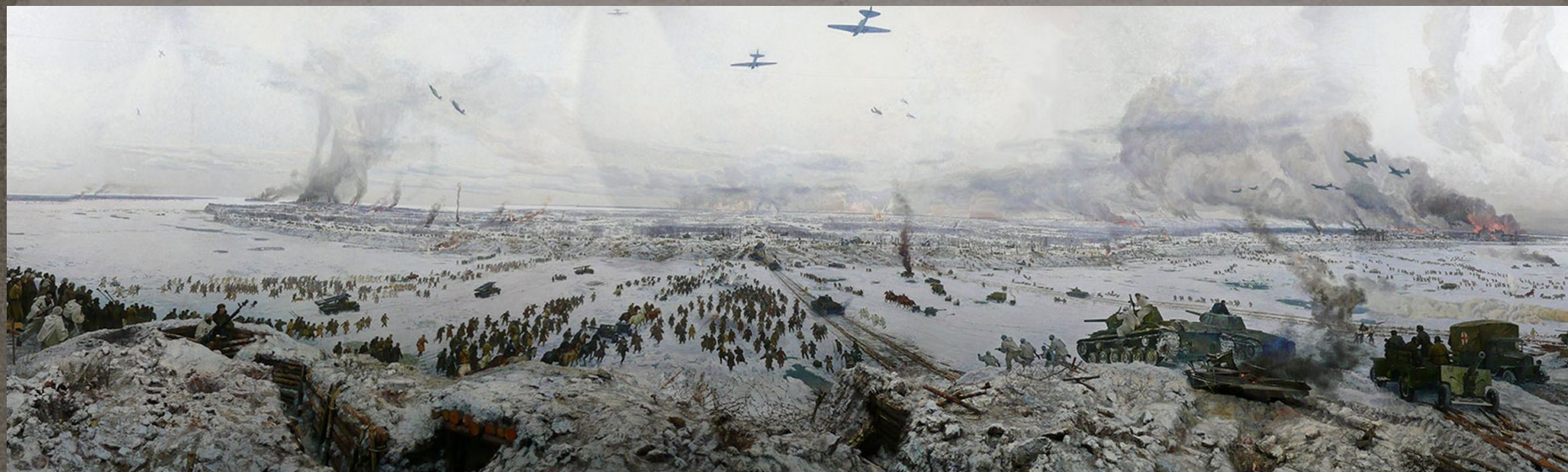
Диорама "Прорыв блокады Ленинграда". Операция «Искра», 12 января 1943 года.