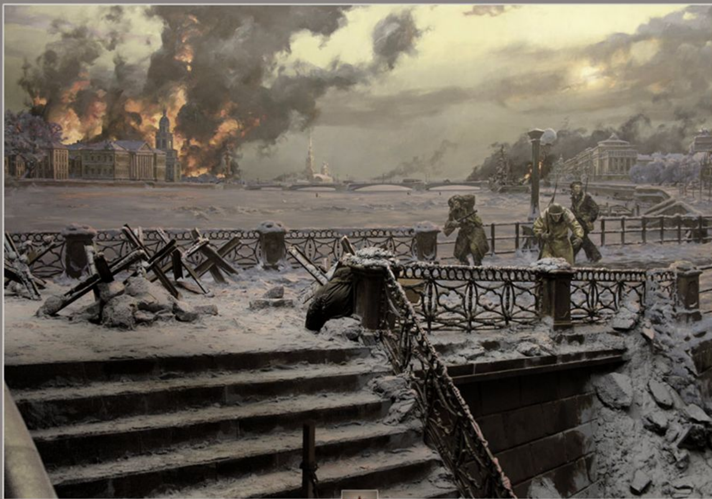
Диорама «Блокада Ленинграда»

Ленинград и его пригороды превратились в мощный укреплённый район. Баррикады пересекали многие улицы. На перекрёстках и площадях грозно высились доты. Противотанковые ежи и надолбы перекрывали все въезды в город.