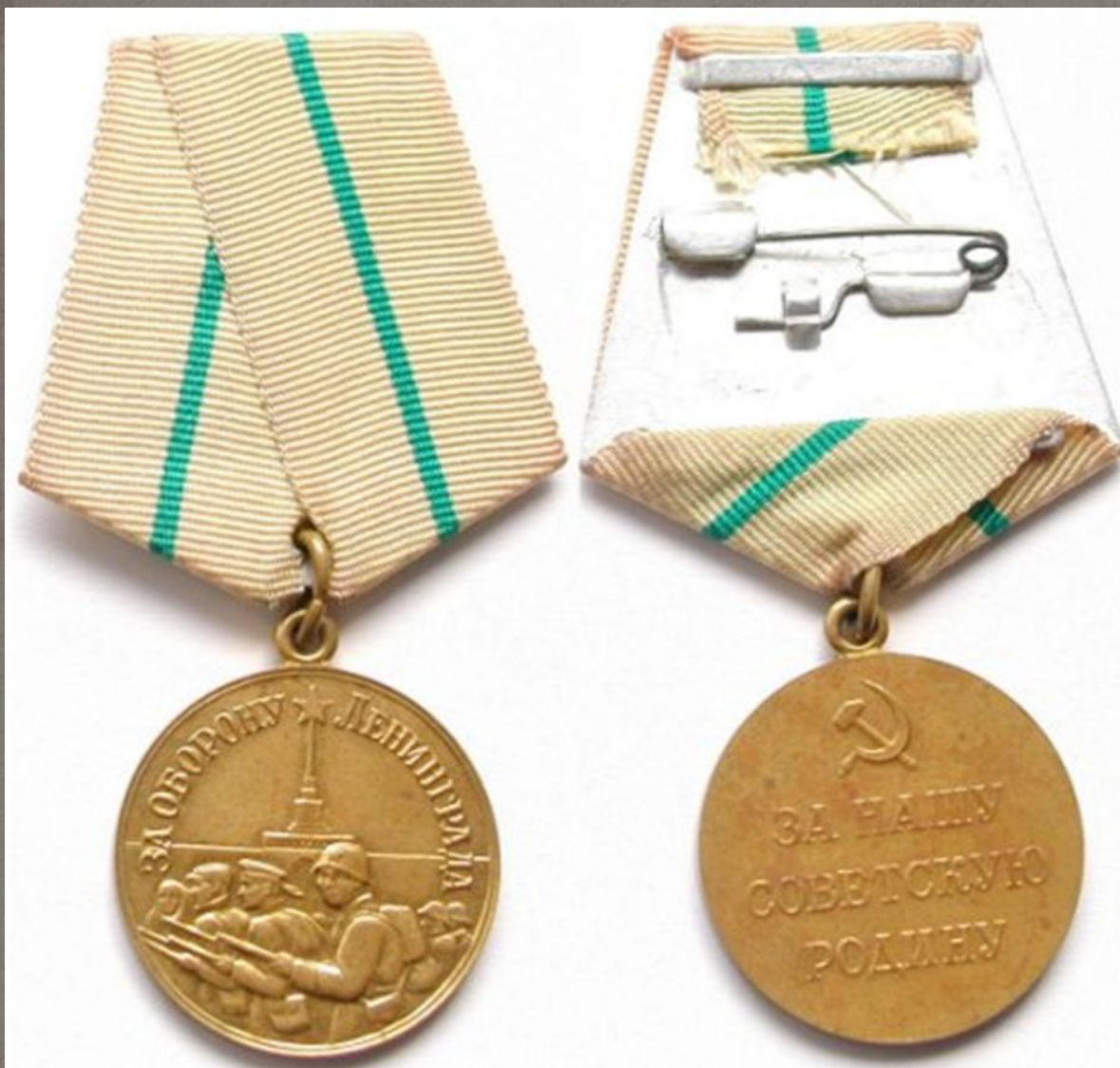
Медаль «За оборону Ленинграда»