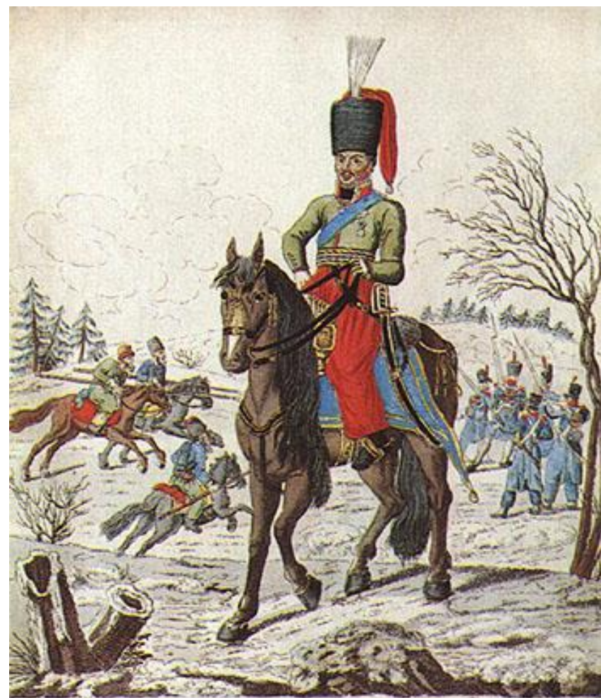
Gy. Platow Wetzmar der Donischen Kosaken.