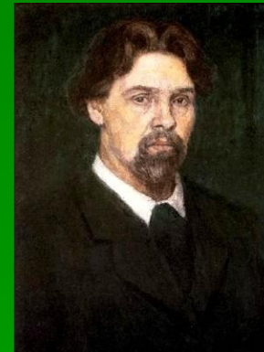
В. И. Суриков