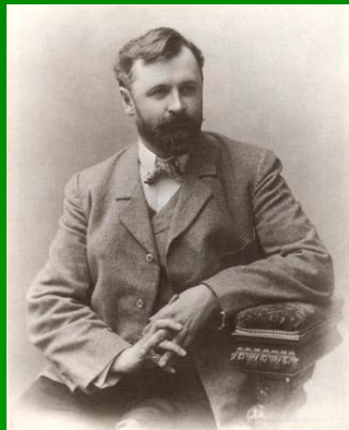
К. А. Коровин