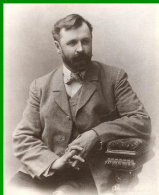
К. А. Коровин