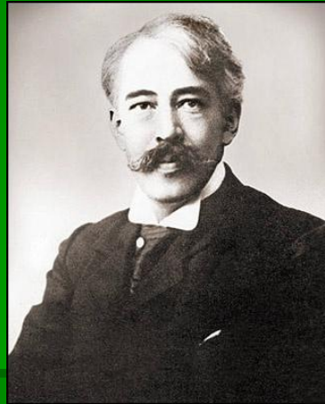
К. С. Станиславский