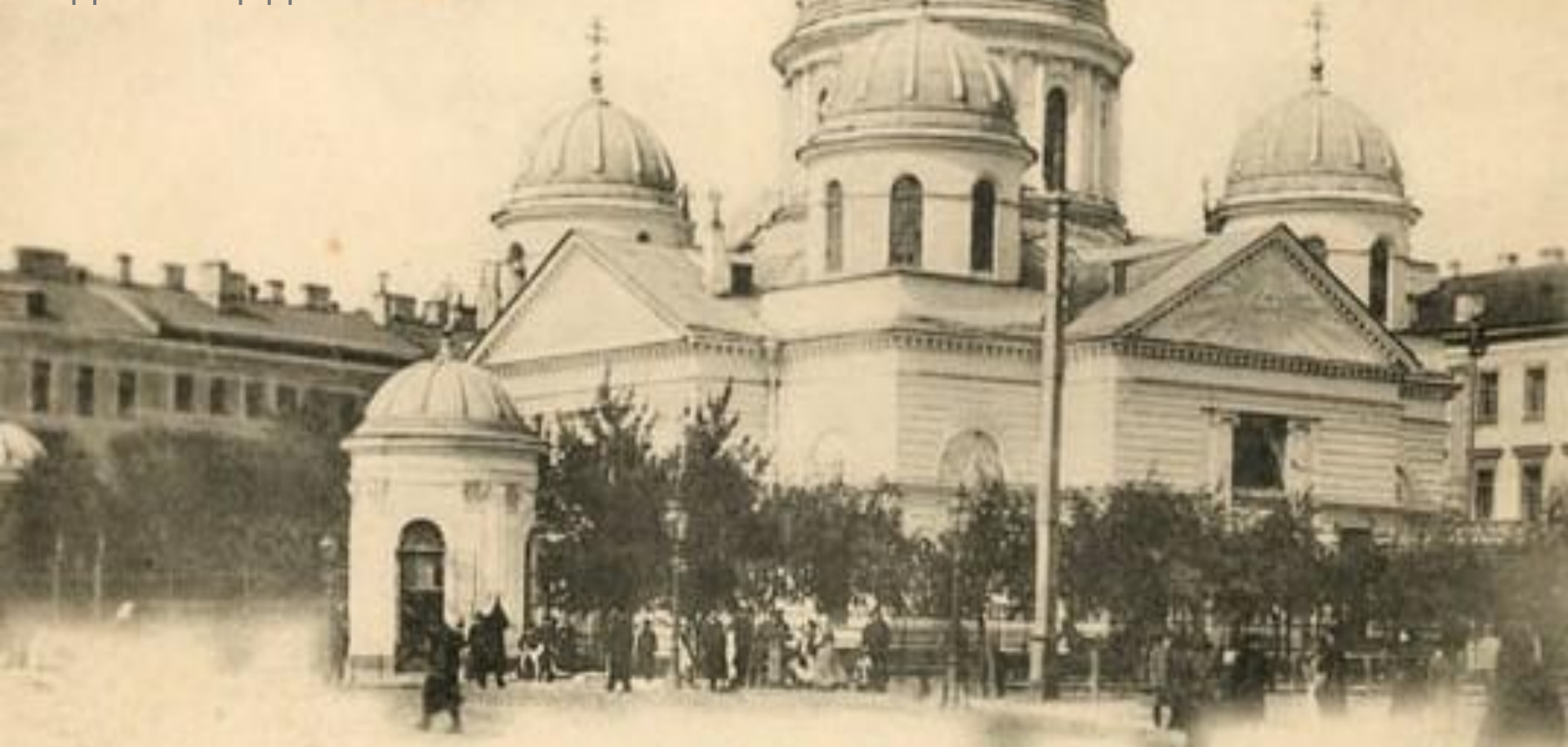
Знаменская церковь — L'Église de l'Apparition de la Vierge

В 1794-1804 годах на углу Невского Проспекта и Лиговского канала по проекту Ф. И. Демерцова была построена церковь во имя Входа Господня в Иерусалим. Церковь в народе была известна как "Знаменская". По её имени и называли тогда площадь - Знаменская.