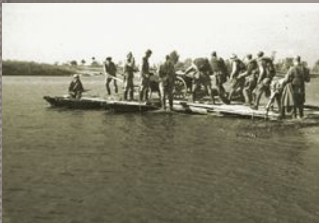
Советские бойцы форсируют Днепр

В результате четырёхмесячной операции левый берег Днепра был освобождён Красной Армией от немецких захватчиков. В ходе операции значительные силы Красной Армии форсировали реку, создали несколько плацдармов на правом берегу реки, а также освободили город Киев.