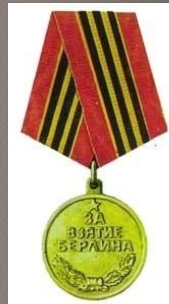
Медаль «За взятие Берлина»