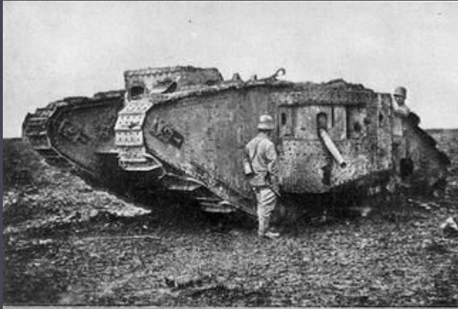
Рис. 2. Первый тип английского танка.