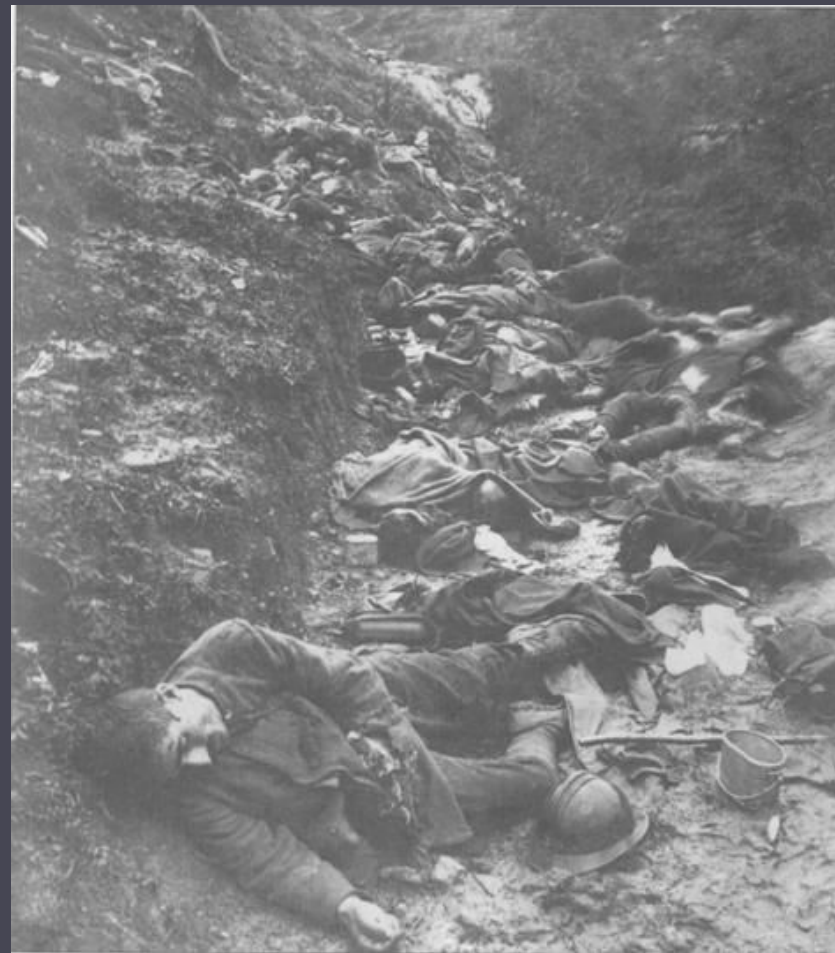
Розгром італійської армії під Капоретто