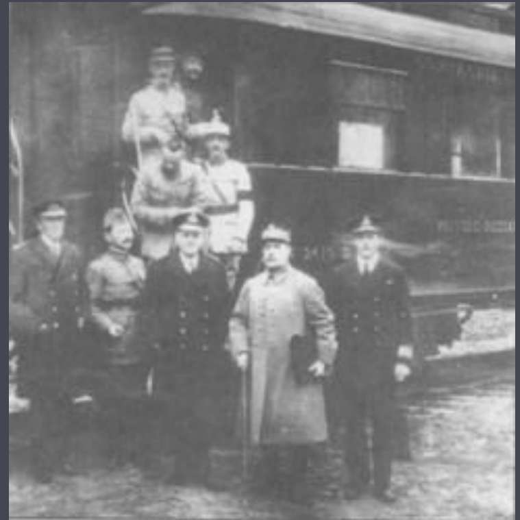
Командуючі військ Антанти після укладення Комп`енського перемир`я (11 листопада 1918 р.).