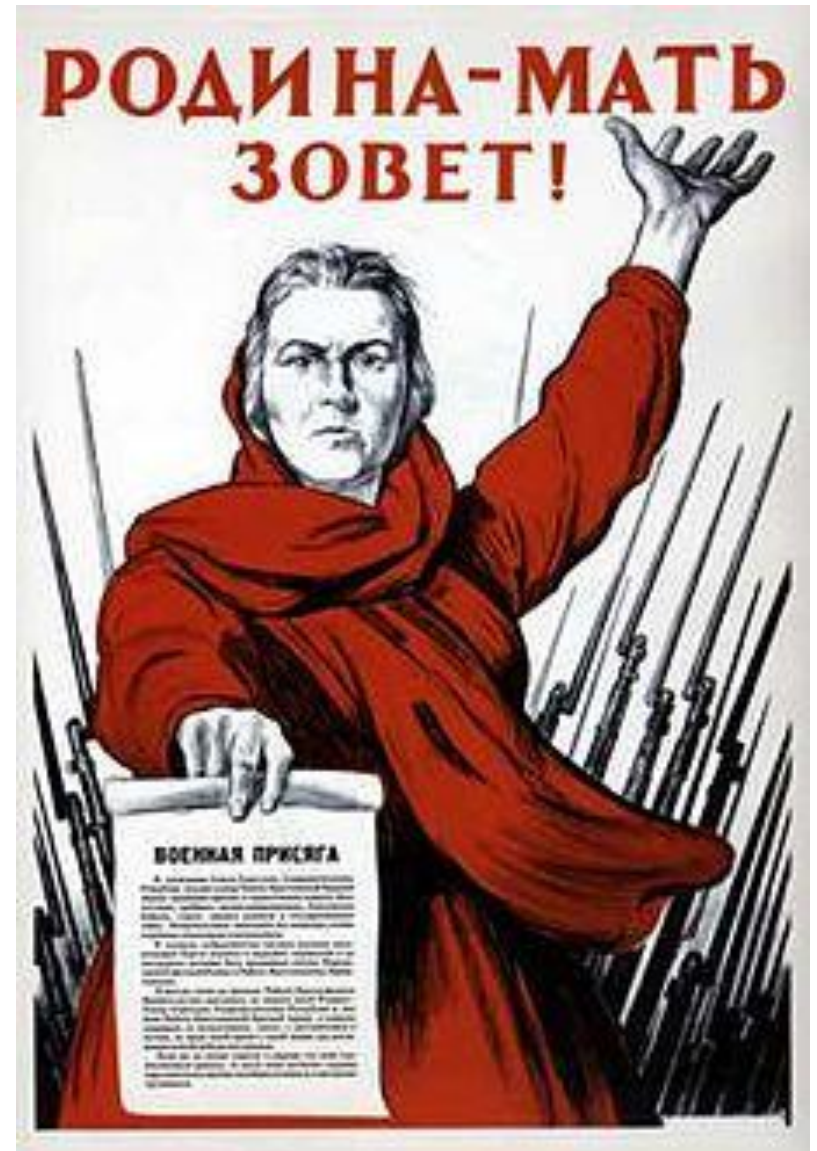
Плакат. Худ. И. Тоидзе, июнь 1941